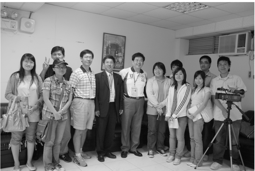
要當一個好的體育記者麼！大專體總平台可供訓練專業知識！

經網路票選獲第一名者將有 7,000 元的等值獎品，第二名有 5,000 元等值獎品，第三名則有 4,000 元等值獎品。學校廣播社團或實習台推薦之作品經票選第一名者，該學校廣播社團或實習電台將獲 5,000 元等值獎品，第二名 4,000 將得 4,000 元等值獎品，第三名也有 3,000 元的等值獎品。其他名次仍有各式獎勵方式，想了解自己的聲音多有魅力嗎？想告訴全世界你的學校多麼棒嗎？幸運地話還有獎金可以拿，你，還等什麼？ http://ner.gov.tw 給你圓夢機會！