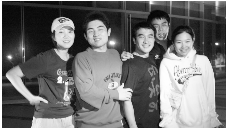
韓籍交換生首次體驗國慶煙火，愛上台北之夜！