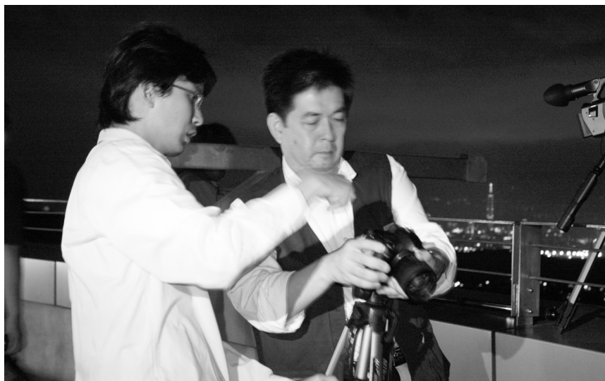
李校長邀大家一起吹風看夜景，享受無障礙視野的煙火觀賞。