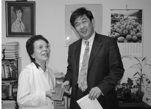
李校長饋贈落花書語 世界友人典藏至寶