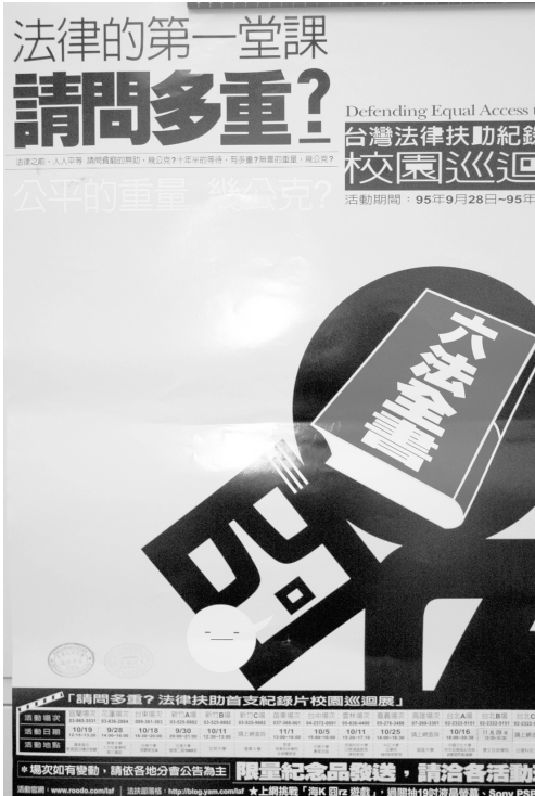
法律扶助紀錄影片校園巡迴展暨座談活動,邀你共襄盛舉!