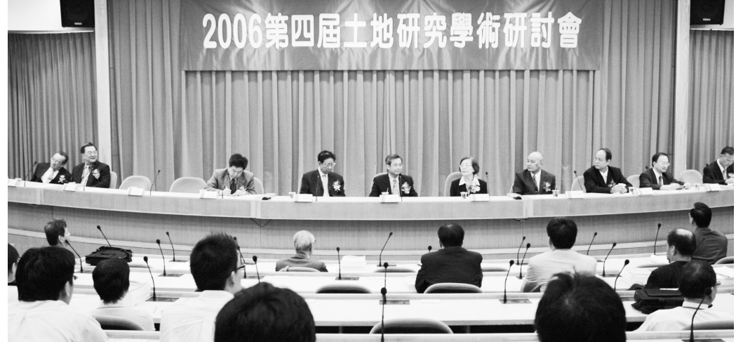
第四屆土地學術研討會邀請張鏡湖董事長、李天任校長、考試院吳容明副院長及內政部長林中森次長聯合為一系列土地專題講座主持開幕。