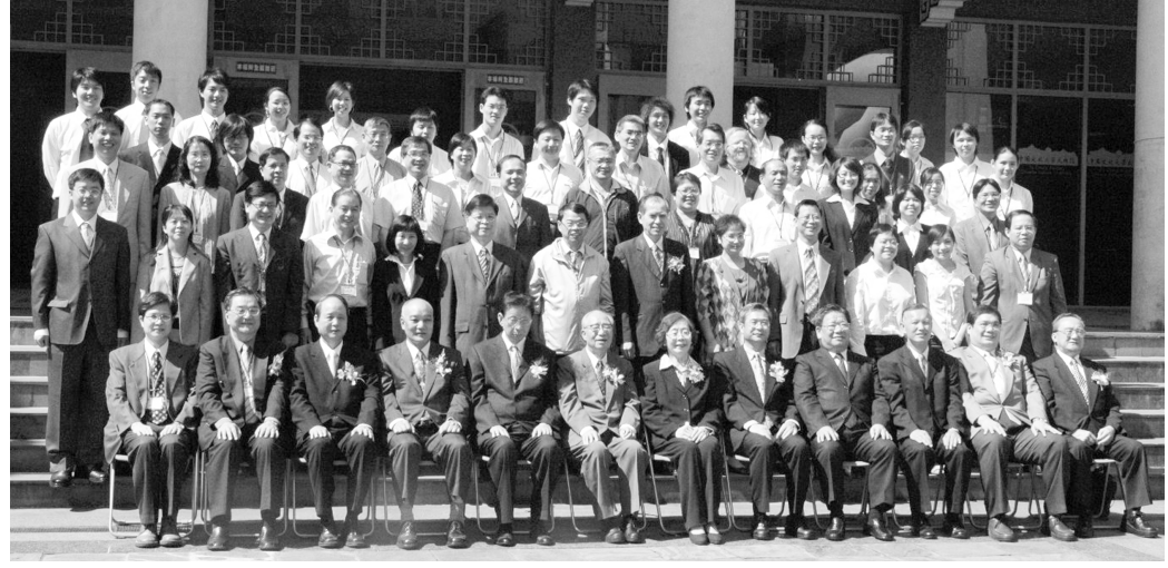
張鏡湖董事長(前左五)考試院吳容明副院長(前左四)內政部長林中森次長(前左三)及本校趙淑德教授(前右六)等合影,為第四屆土地資源研討會開幕留下美麗扉頁。