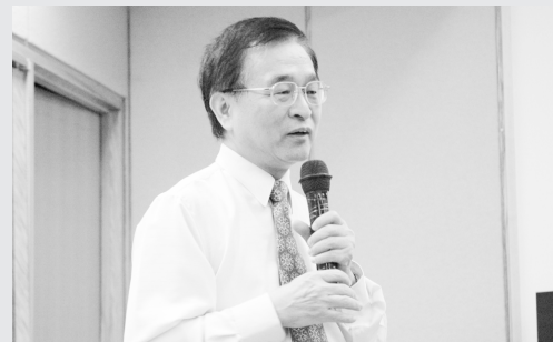
梁館長邀請師生進入張愛玲文學

週三中午,陸續推出各種不同風味的「精緻小點」,有文學、藝術、科技等多樣性的主題,提供文大學生午間休閒的知性選擇。圖書館也以「張愛玲」為主題,展出一系列海報。內容包含張愛玲文學年表、張愛玲插畫精選、李秋鳳及于青所撰寫關於張愛玲的文章。現場並展出本館所典藏的張愛玲著作及其相關書籍與影片,是喜愛張愛玲的你不容錯過的展出!