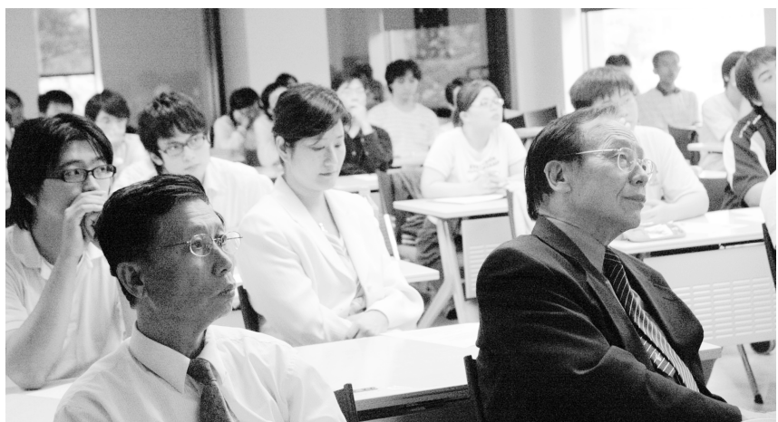
空間魔幻科技世界吸引滿座師生，揭開空間資訊美麗序章。

鄭院士最後還開放半小時的討論時間，分享每一個聆聽的師生疑問，正因語言的繽紛多彩，發表者踴躍，討論熱烈，也為「空間資訊系統」系列專題開啓美麗