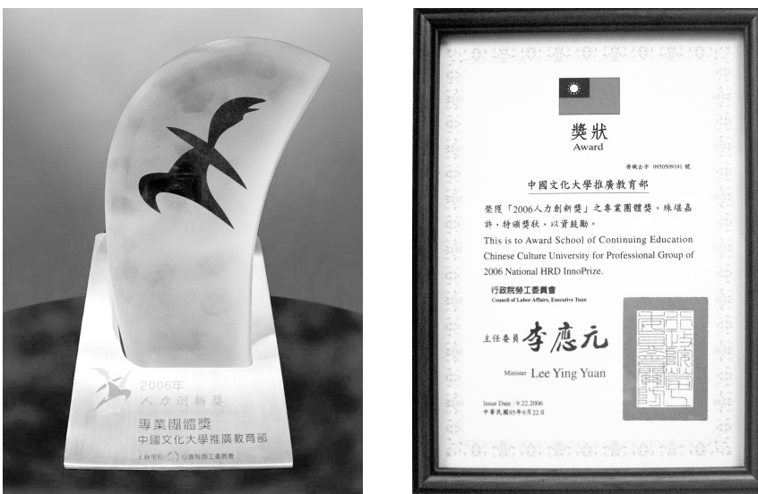
推廣教育部獲「2006 人力創新獎專業團體獎」殊榮。