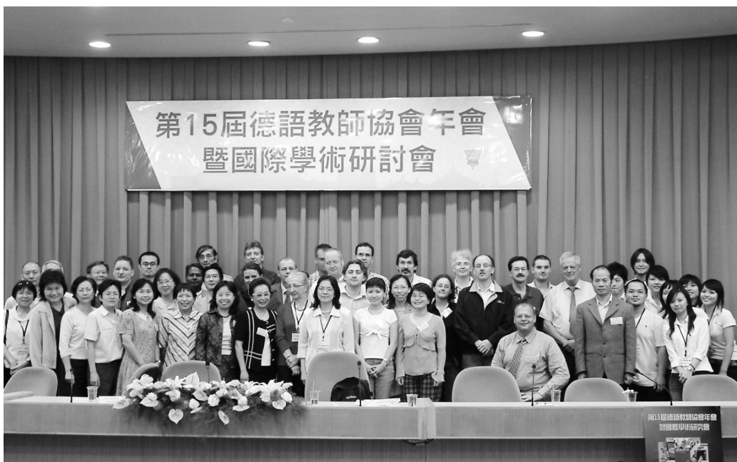
第 15 屆德語教師協會年會暨國際學術研討會，與會學者於曉峰國際會議中心前合影。

最後，華洛寧副教授提到，基輔大學的圖書館是全烏克蘭最大的一座圖書館，館內共有超過 350 萬本書籍與雜誌，期待各位同學能親自到烏克蘭體驗基輔大學的美。