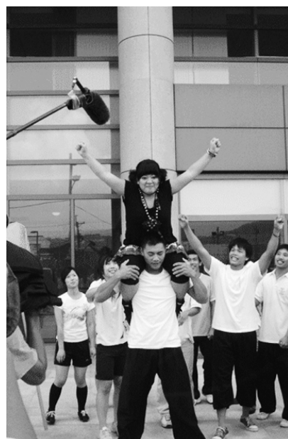
東風電視台主持人與體育館體操啦啦隊（一層一層合作無間的舞界精靈）合影

學生會表示，這次的節目錄影可以讓外界更深入地了解文大，校內同學也可重新認識學校特色。若對節目想知道更多內容或其重播時段，詳情請上： http://www.aziotv.tv/program/star_usb/index.asp ，明星隨身碟邀你一同揭開華岡傳說神秘的面紗！