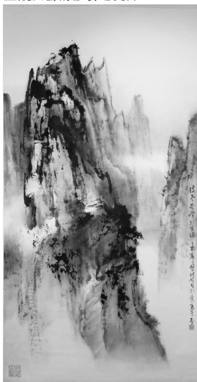
歐豪年教授之「畫盡奇峰」邀您一同享受中國經典山水畫。