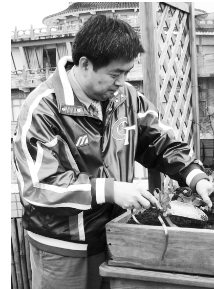
李校長為校園舒壓療癒花園種下高麗菜幼苗，期待明天早春一起享受綠地盎然之美。

手引進國外最自然的景觀治療設計工法，利用 3 原色營造療癒環境，透過「感受」(Being)與「使用」(Doing)雙重庭園自然療法，讓師生浸淫 SPA，紓解情緒，享受自然的生命動力，減低工作與課業的壓力。