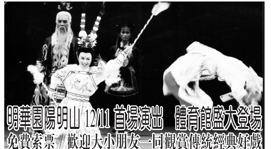
明華園陽明山 12/11 首場演出 體育館盛大登場 免費索票 歡迎大小朋友一同觀賞傳統經典好戲

郭毓仁教授解釋，景觀治療透過「感受」庭園及使用 5 種感官刺激，沉靜心靈，加上動手「使用」照顧植物，從中得到舒壓治療。