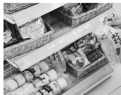
多注意生鮮商品的食用時間，為健康加分。