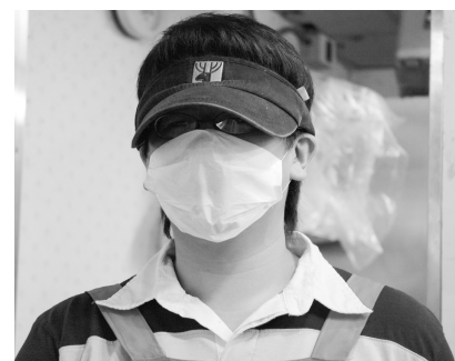
好的飲食環境，健康之道。

今年的主要檢查為針對食品中是否含有過量的大腸桿菌，校方為達成標準之檢測品質，特別採用簡便、立即可使用的大腸桿菌指示劑來檢測各商家之餐飲；同時針對各個商家四周環境整潔部分與店員個人衛生方面全方位檢