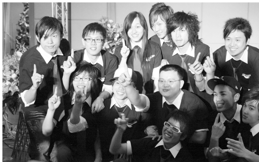
銘傳大學緣續文大。

好的記憶。 今年銘傳大學以「緣續」為展出主線，首度加入此活動，以「緣續」命名，是因為跨校參加，各種童話故事中也存在著一股若有若無的緣份，故取之為「緣」；而且也希望未來的學子也能夠「延續」這個夢想，並精益求精。 然而，僑生認為唯一美中不足的是，現場的場地過於狹小，讓遠從馬來西亞、緬甸、泰國的雙親父母沒有足夠的地方可以歇息，希望學校未來可以開放表演場地，盡情發揮學生無窮創意。