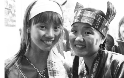
海青班向同學展現異國熱情風