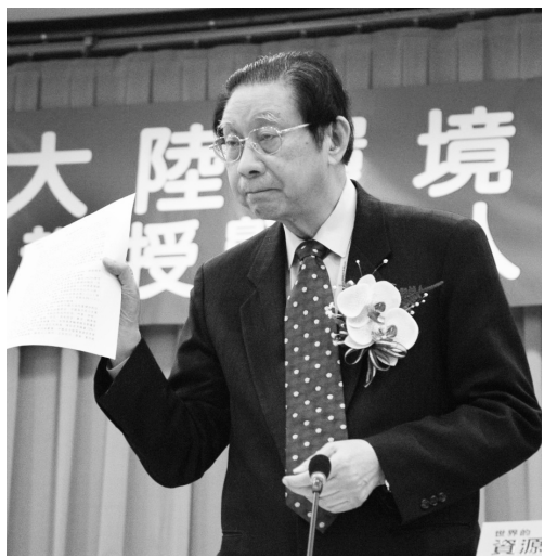
張董事長憂心大陸環保問題，12 大項課題剖析大陸未來。

的問題，由於沙塵暴會使大陸的沙漠面積擴張，其沙塵狀況將可達台灣與美國西部，對世界環保問題造成衝擊，這是未來值得重視的重要課題。