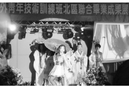
服裝秀吸引不少同學駐足觀賞