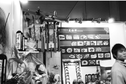
食物創意離展，秀出學生無窮創意