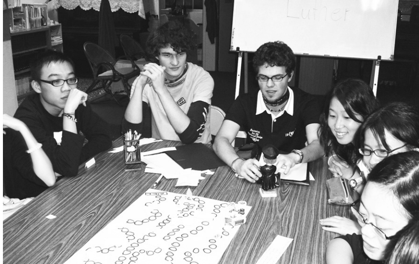
想要學德語麼！德文系與山仔后基督教會合作，讓同學們感受來自德國2位義工老師幽默風趣的語言魅力。