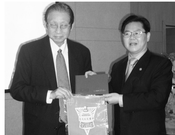
張董事長(左)與廈門大學朱崇實校長(右)簽訂「學術交流與合作協議書」。