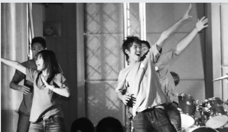
舞霸華岡，華岡邀您一同舞躍青春！

體育室規定今年熱舞大賽每隊參賽人數為 3 人至 10 人、每隊表演時間 3 分 30 秒至 5 分鐘為限，參賽音樂則由各隊自行準備，並於比賽報到時繳交大會。由於將決選第一名冠軍代表本校參加全國熱舞大賽，晉級決賽的隊伍實力陣容堅強，歡迎全校師生屆時前往體育館為這些隊伍加油打氣，感受這股青春舞群的熱情創意。