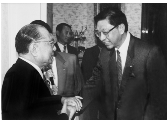
文化人生 教育是頁心事業！

出生年月：03.18.1927 學歷：1948 浙江大學史地系畢業 1954 美國克拉克大學地理學博士 經歷：1954-1956 美國約翰霍普金斯大學研究員 1956-1958 美國哈佛大學研究員 1958-1959 美國威斯康辛大學研究員 1959-1964 美國地理學會雜誌編輯 1959-1984 美國夏威夷大學教授 1972 加拿大維多利亞大學特約講座 1969-1972 南洋大學校外考試委員 世界銀行聘請為巴西熱帶農業研究所顧問(貝倫, 巴西) 1978-1984 香港中文大學校外考試委員 1981 聯合國文教科組織熱帶水災與氣候委員會召集人 1983-1986 中華民國國科會特約講座、臺灣大學地理系教授 1984-迄今 中國文化大學董事長 1987-迄今 華岡藝術學校董事長 1999.01.22 國際歐亞科學院院士(中國分院) 獲獎榮譽：1994.09.29 韓國慶熙大學名譽博士 1996.04.03 日本創價大學名譽博士 1997.04.24 俄羅斯聖彼得堡大學名譽博士 1997.08.12 日本東京富士美術館最高榮譽獎 1999.05.21 日本創價學園最高榮譽賞 1999.12.05 日本創價大學文化教育最高榮譽獎 2001.09.27 韓國慶熙大學大學章(最高榮譽獎) 2001.03.24 中華民國第一屆私校十大傑出教育家 2002.06.15 韓國湖南大學經營學名譽博士 2002.11.27 日本國士館大學名譽理學博士 2002.10.09 韓國「金大中總統領獎」 2003.03.24 美國創價大學「最高榮譽獎」 2006.03.01 美國創價大學「名譽大使」 2006.04.19 韓國安東大學頒授名譽理學博士學位 2006.06.16 美國克拉克大學頒授名譽人文學博士學位