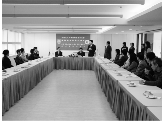
忠北大學與本校在體育館8樓，締結姊妹盟約。

【文 / 吳蕙如】2月1日下午文大與韓國忠北大學於體育館8樓柏英廳簽定締結姊妹校合約，由張鏡湖董事長、李天任校長與忠北大學林東喆校長共同簽署。忠北大學林校長表示，希望未來兩校能成為模範姊妹校。