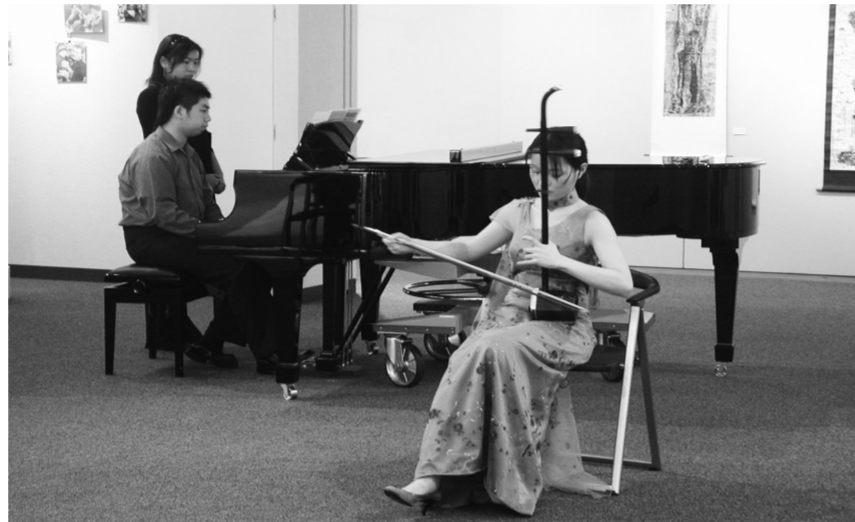
「逍遙音樂會」於曉峰紀念前廣場演出，歡迎全校師生前往聆賞。

「戶外逍遙音樂會」邀請本校藝術學院同學於曉峰紀念前廣場演出，一場場與樂器音符的邂逅，享受沈浸在另類的音樂宴會之美。此外，圖書館與博物館聯合舉辦「浪漫咖啡香」活動，行動咖啡車在曉峰紀念前廣場，邀請師生品味浪漫藝文。