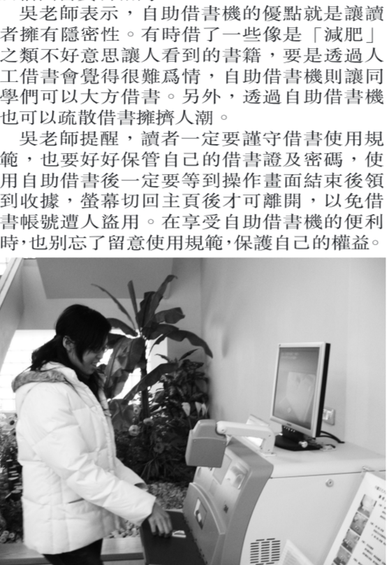
自動借書機吸引不少學生操作使用。

學生專區 網路學生身分證 一指搞定生活大小事 別架構選課清單、教材區、師生討論區及各項公告看版，讓學生與授課教授可以隨時上傳課程大綱或各種教材規劃，讓學生一指掌握課業，相當方便及先進。 資訊中心規劃的留言板專區，也成為同學間互動留言的網路平台，每個學生選特別有 200MB 的網路硬碟，隨時帶著資料上傳下載，讓校園網路世界成為學生生活的重要角色。 數位學習類則是連接世界知識道路的重要平台，其間的各中線上學習課程及知識隨選系統及圖書館視聽服務，培養學生人文藝術與語言學習的另類管道。尤以資訊中心特別與知名廠商 LiveABC 互動英文教學集團合作，學生可利用「學生專區」網路點選學習英文，邁向國際人腳步。李天任校長表示，Live-ABC 互動英文教學集團免費提供英文學習網路教材及各級檢定英文測驗，奠定華岡網路英文學習新里程碑，未來本校還會結合外籍老師學術資源，達到加乘效益。 圖書館的隨選系統，人文藝術與網路現代結合，學生不但可以上網看電影，近來與公視合作的影片交換，學生還可以欣賞歷史文學大作，培養新文化觀。