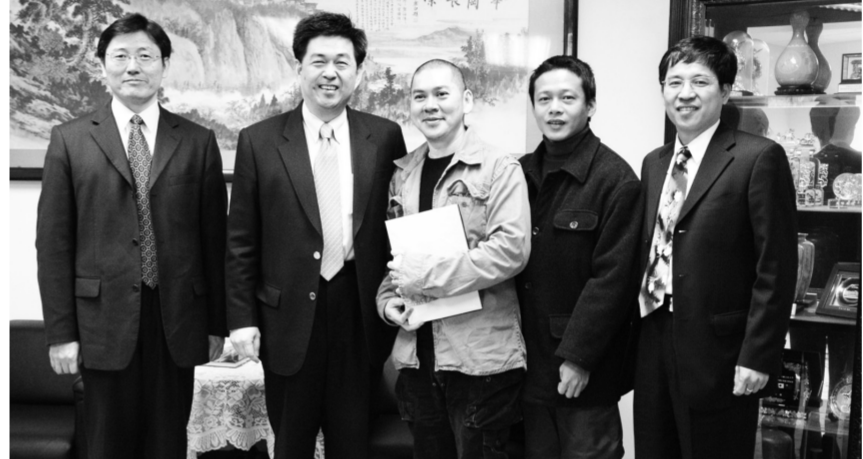
蔡明亮導演(中)、黑眼圈男主角演員李康生(右二)與李天任校長(左二)、林柏杉學務長(左一)及唐彥博總務長(右一)於大恩 12 樓貴賓廳合影。

【文 / 王景新】文大之光！國際知名導演，2005 年以《天邊一朵雲》獲得柏林影展銀熊獎的本校戲劇系傑出校友蔡明亮導演，12 日蒞臨文大，為新片「黑眼圈」宣傳，並與本校李天任校長