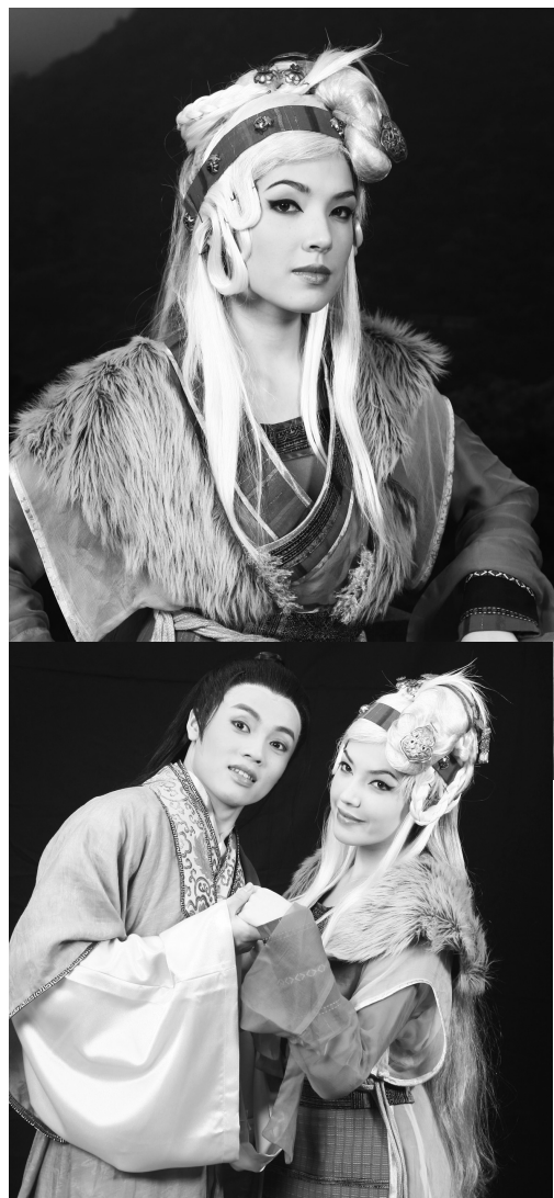
許瑋甯在為家路窄中，將展現融合多種元素的戲劇風貌。由朱錦榮執導、李寶春擔任藝術總監的年度大戲，邀請你蒞臨觀賞。

為了打造新時代的東方歌舞風潮，文大這次演出特別費心結合了傳統與時尚，希望能透過京劇名家李寶春、國光劇團導演朱錦榮以及時尚名模許瑋甯三人的風采，再次創造東方舞台藝術的巔峰。