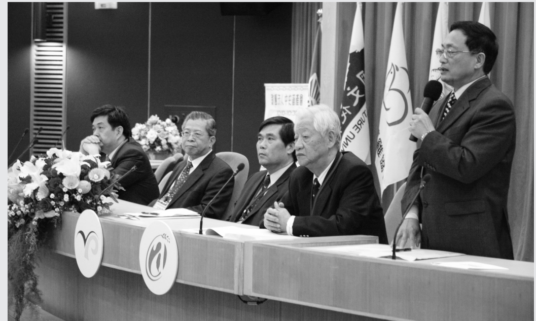
「家禽保健與產業發展論壇」19日晚峰紀念館登場。

之影響，但由於保護消費者環境健康是行政院農業會的任務工作，也是國內業者應該合力配合的政策，只要齊心努力，就能合力創造乾淨優勢商機，同時可避免出現類似亞洲禽流感病毒的大流行，確保台灣的衛生形象。