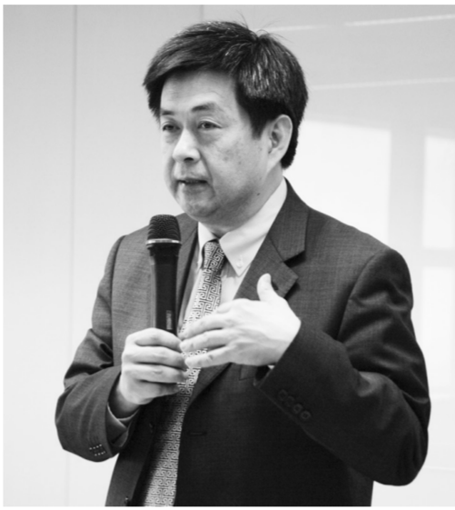
李校長宣示，華岡校園由e化校園推展進入智慧化校園。

與家長連絡，或實施家庭訪問或住宿訪視。必要時應主動通報系上或轉介學生諮商中心，以採取相關處遇措施。