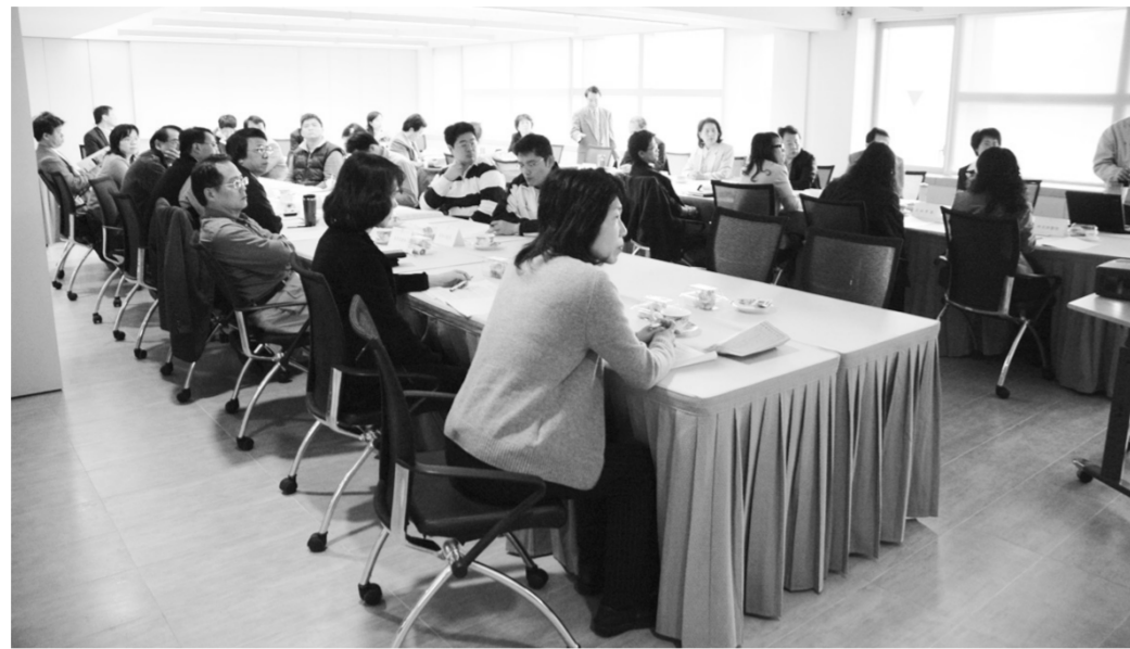
各學院主管列席會議關心學校各項發展。

學務處今年持續與資訊中心推出「校園e化」新制，包括修改網路導師平台制度與網路請假辦法，透過e化校園，