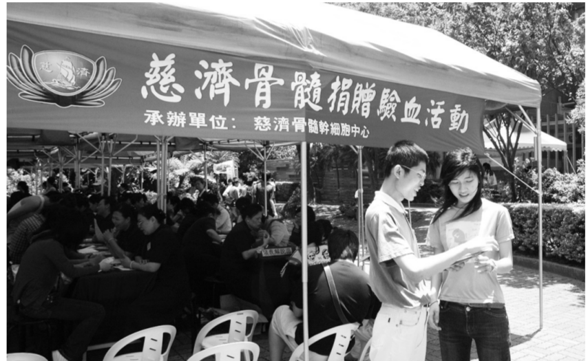
華岡人響應骨髓捐贈驗血活動，熱髓愛心，不落人後。

有鑒於此，這次慈濟的骨髓捐贈驗血活動也希望欲捐贈思考清楚，聽過解說再經父母同意才可捐贈。