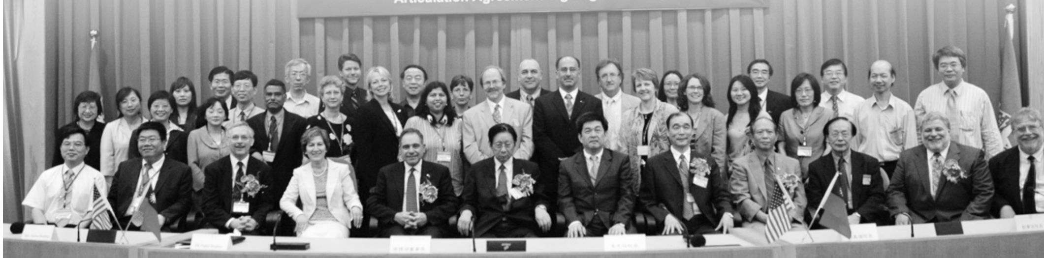
「全球化與校際合作國際研討會 (International Symposium on Globalization and University Collaboration)」與全體參與者貴賓合影。

【文 / 李文瑜】國際校際交誼邁大步，首度與姐妹校普渡大學與大同大學聯合主辦大型國際研討會，由普渡大學副校長 Nabil Ibrahim 及其夫人 Salwa Ibrahim 聯袂來台灣主持「全球化與校際合作國際研討會 (International Symposium on Globalization and University Collaboration)」，連續三日的研討活動，邀請來自歐美及台灣近 20 位學者參與討論，將近 10 場次的研討論文，以生動活潑的英語式發表論文，讓不少台灣學生