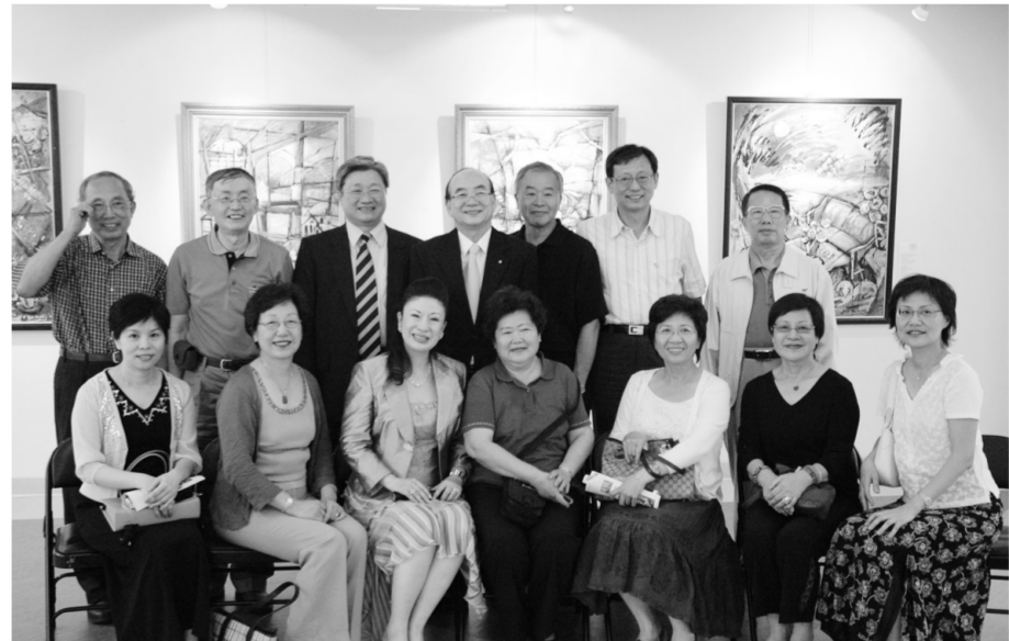
何和明教授 (後排右四) 邀請全校師生進入時空交錯的彩繪天空。