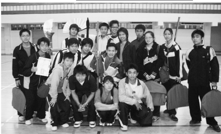
文大代表隊出賽「全國武術中華盃」，總計拿下 22 面獎狀成績斐然。