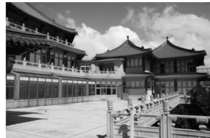
華岡之美，豐富個人部落格。

新增檔案後按下「Admin」，進入管理介面，在「檔案中心-新增檔案」中，先選擇「新增資料夾」，建立資料夾之後就可以開始上傳。