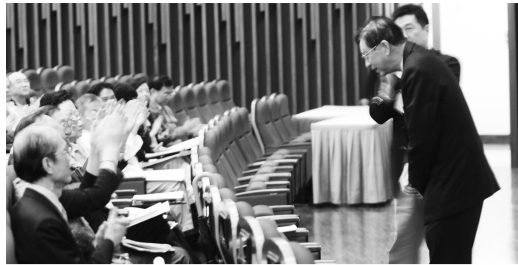
張董事長感謝所有曾是華岡人為華岡的奉獻