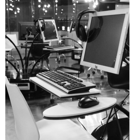
華岡數位校園邀您一起上網書寫大學部落格！

目前「師生部落格」不僅可以發表網誌，連絡師生情誼，還可上傳照片、影片與音樂，功能一應俱全。資訊中心強調，為豐富部落格的平台，還特別提供十多種華岡風情的照片，讓美麗的華岡景緻隨著部落格風情，展現獨一無二的文大部落格。最為特別的是，部落格裡有各式各樣的連結方式，只要連結到「我的最