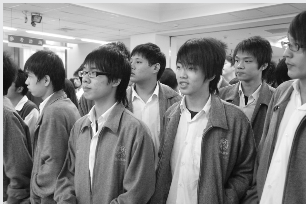
泰北高中同學讚嘆校園e化設施，期待成為文大人。

泰北高中同學表示，文大圖書館e化，讓查資料簡單便利，借書更方便，這可是每一個大學生入學的最棒體驗，期許未來有機會可以成為華岡資訊人。