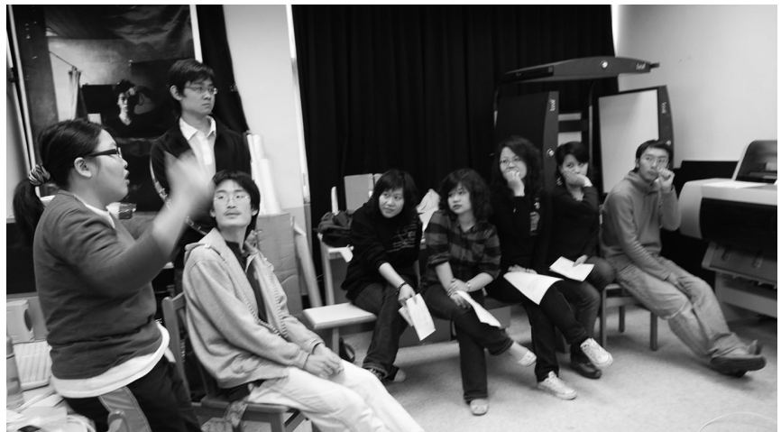
資傳系 ISG 影像研究小組的成員們透過相機，記錄校園的點點滴滴。