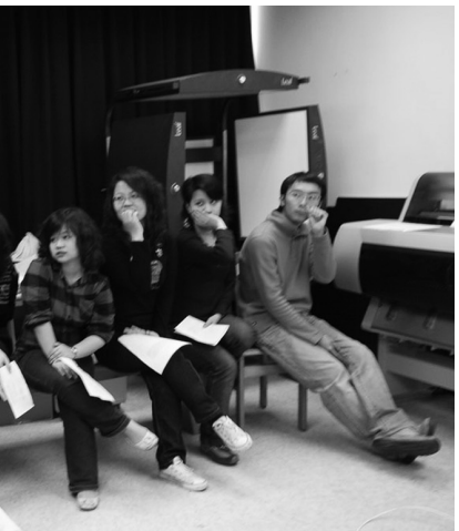
資傳系 ISG 影像研究小組的成員們透過相機，記錄校園的點點滴滴。