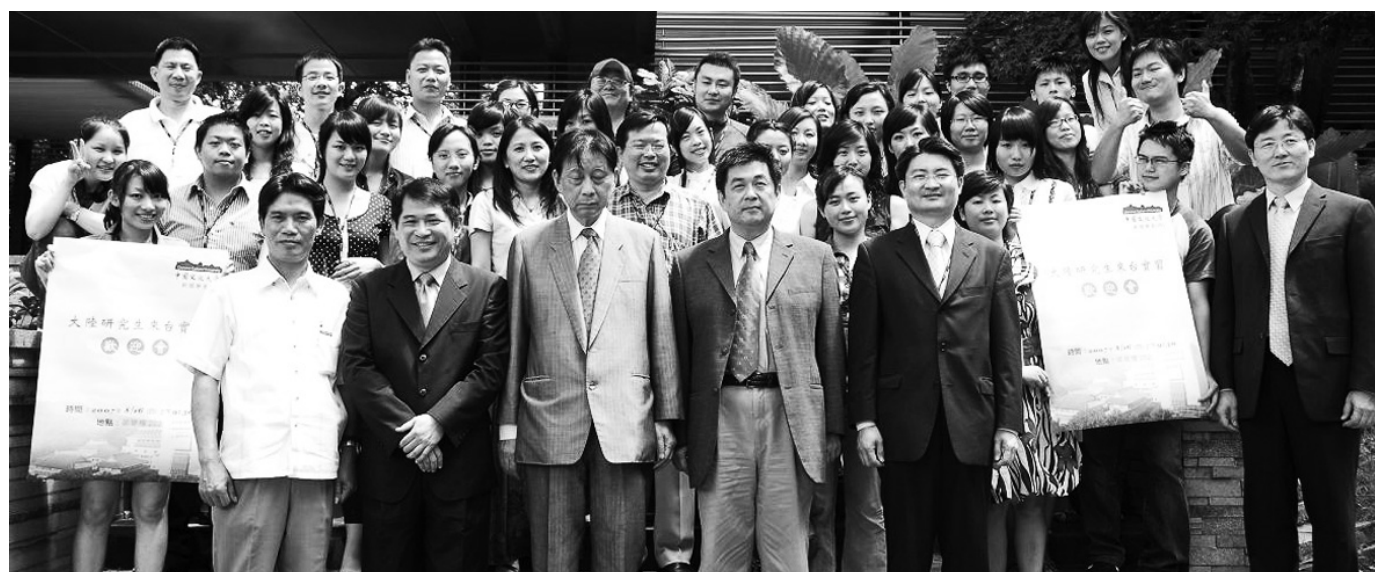
新聞暨傳播學院特於大陸研究生離台前夕，動員全體師生12日於興中堂盛大舉辦歡送會，透過遊戲與歌唱等活動師生同歡。

此外，文大新聞所同時安排大陸研究生參訪電視台、遊覽台灣著名景點，以及深入體驗台灣人文風情的環島之行，促進兩岸學生文化及學術交流，讓這趟兩岸的「文化之旅」滿載而歸，新聞暨傳播學院特於