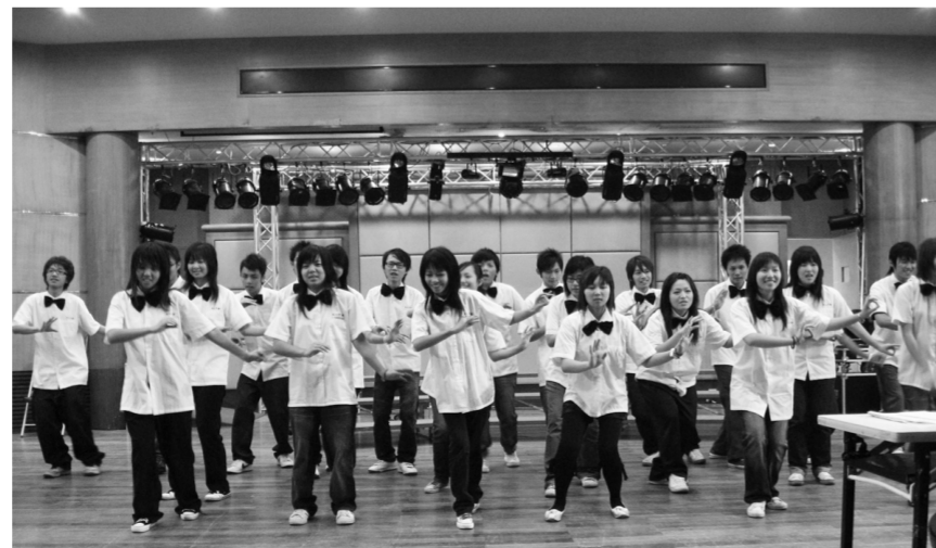
各系參賽者搭配另類演出，讓比賽精彩萬分。