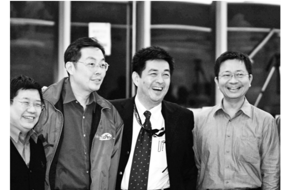
96 學年度系所評鑑，凝聚了學校師生的向心力！

高等教育評鑑中心基金會」所辦理，亦為國內大專院校首次舉辦針對學系及研究所而進行的評鑑，以「目標、特色與自我改善」、「課程設計與教師教學」、「學生學習與學生事務」、「研究與專業表現」、「畢業生表現」等 5 項為評分項目。 評鑑以五年為一循環週期，以教學評鑑為主，不採統一固定評鑑指標，並由系所自我舉證資料，作為評鑑依據。李天任校長表示，評鑑只是起點，雖然 96 學年度的評鑑已經告一段落，但未來華岡仍有待文大人的努力與付出，為打造美好學習環境，邁向多功能。化而打拚。