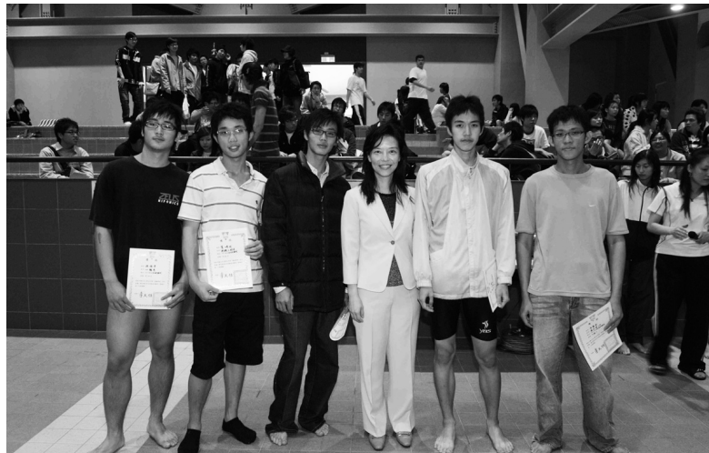
新宗政教務長(右三)與游泳比賽男子組獲獎同學合影。