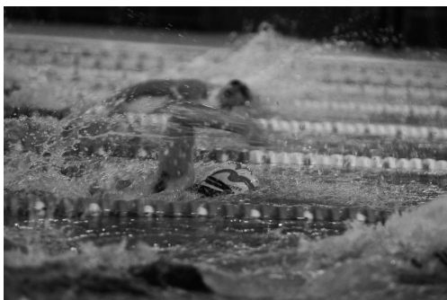
游泳選手不畏寒冷水溫，奮力贏取佳績。

之外，帶給參賽者最大動力的加油團陣容也相當龐大，讓游泳池畔一時熱絡了起來。特別是各系啦啦隊在場邊的歡呼，從場上到場外，充分顯現各系的團結精神。