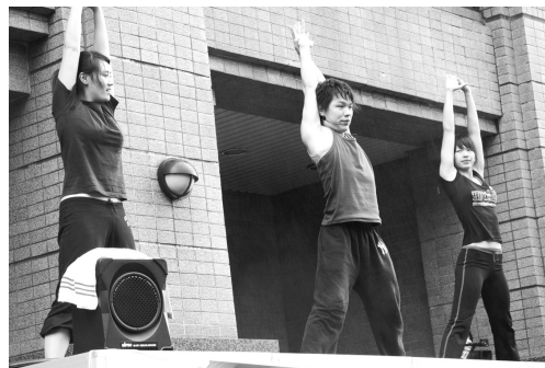
健康路跑前，舞者帶動現場選手熱身操。