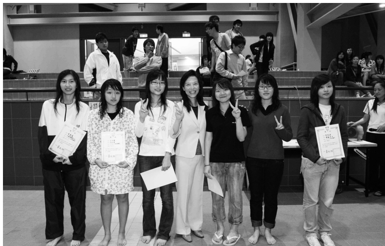
新宗政教務長(右三)與游泳比賽女子組獲獎同學合影。