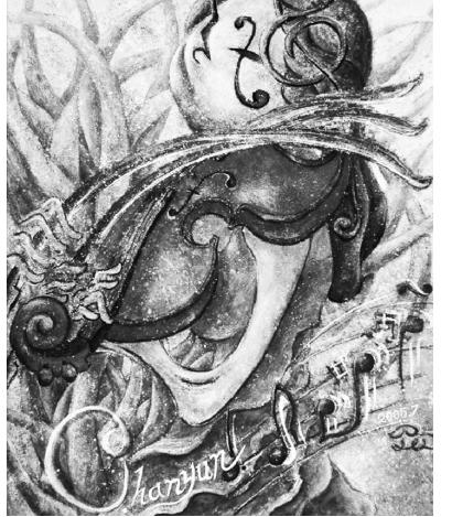
結合東西繪畫元素的雙展協奏曲，歡迎師生蒞臨欣賞。