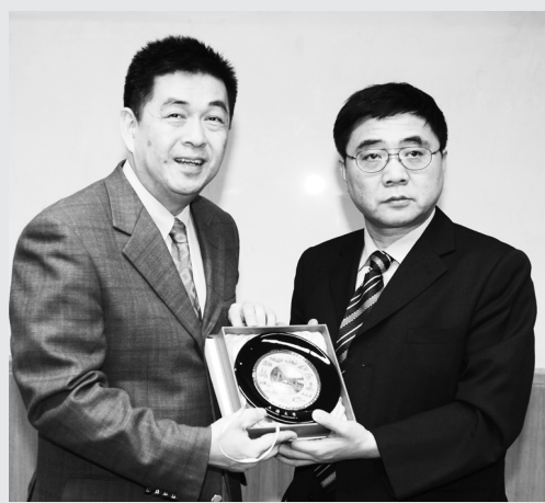
李天任校長(左)與上海大學葉志明副校長(右)互贈見面禮。

上海大學葉志明副校長表示，上海大學是一所綜合性大學，現設有22個學院，除了農、醫、教育、軍事外，具有完整的學科教學，自復校以後，積極的展開國際交流與合作，近年來更以構建綠色、文明、資訊化校園，打造與上海現代化國際大都市地位相適應的高層次人才教育體系，和科技創新體系為目