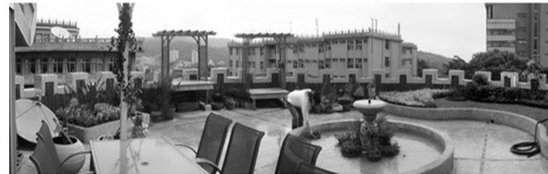
引自國外自然的景觀治療設施，利用 3 原色營造療癒環境。