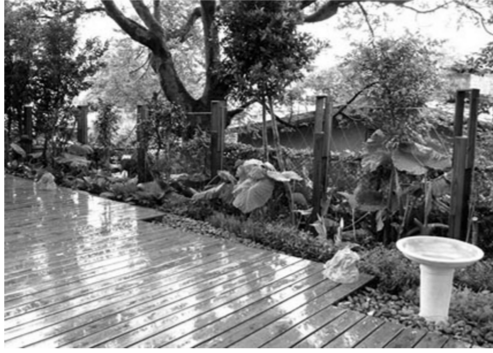
親和性的圍籬，讓整體環境趨向和諧化。

郭院長說，經校內環境設計學院、心理輔導系、藝術學院及園藝系等領域專業的交流討論後，藉由校園資源的整合以及搭配景觀治療之設計、空間使用規劃、環境塑造、校園軟硬體等元素，提供一獨立性的菲華樓開放空間，並以整合式的「治療」元素設計，融入音樂、色彩、藝術、園藝等多角度接觸界面，希望經由休閒與生活學習的自然過程，獲得心理舒緩與漸近性的身心平衡，營