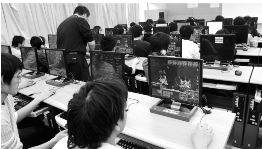
秦教官以創意的線上遊戲作考試評分，吸引許多學生加選軍訓課程。

提供文大師生便捷服務，中國信託商業銀行於每週一、三、五上午 11 時至 14 時 30 分，在大