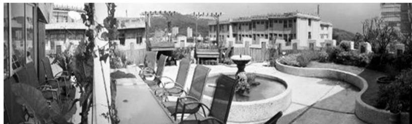
全國首創的「校園舒緩療癒花園」，希望讓觀賞者獲得情緒的抒解。