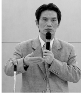
施登山總務長(右)期許師生節