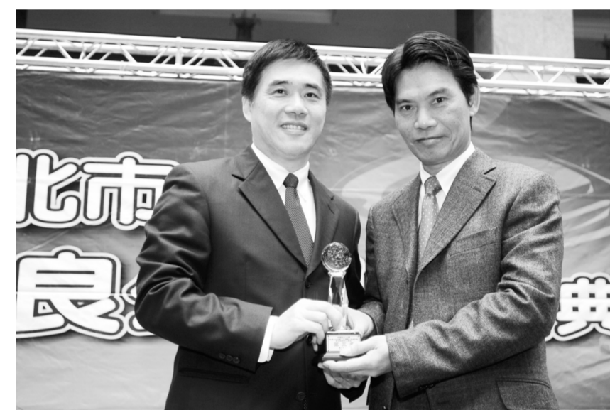
施登山總務長（右）接受台北市市長頒發獎座。

廁所都有掛上畫或者盆栽，以及貼附溫馨的小字條，男廁更在每一個小便斗設上隔間，以及置物架，希望帶給師生乾淨、舒適的如廁環境。