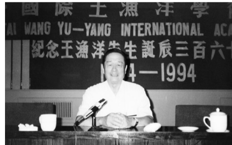
「紀念王漁洋先生誕辰三百六十年國際學術研討會」，發表論文。