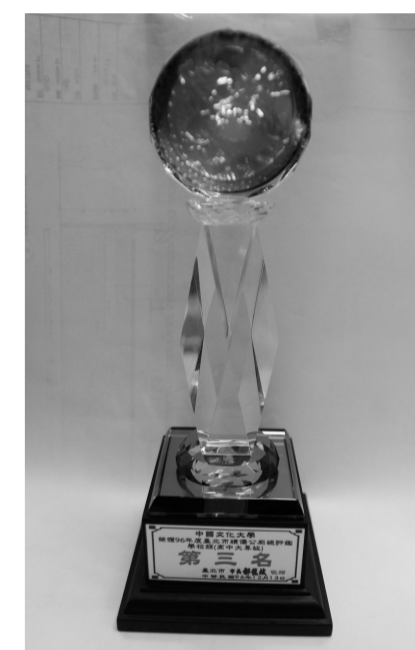
本校榮獲公廁評比第三名，象徵文大對營造優質校園空間及衛生保健的重視。

校園整潔，人人有責」，使用廁所時別忘了體恤打掃人員的辛苦，共同環境的清潔，洗手時小心別把水滴到地板上，就能維護地板的清潔。