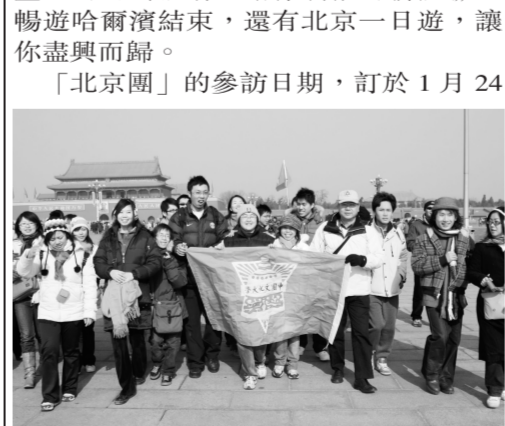
冬令營「哈爾濱」、「北京」、「上海」交流之旅，帶給你最超值優惠的行程。

日至2月2日，預計18,800元，10天9夜的行程，除了將參訪北京著名景點，如八達嶺長城、天壇、世界文物館藏量前三名的故宮博物館、頤和園等行程外，午餐更可享有令人垂涎三尺的北京烤鴨。至於現在最Hot的奧運館場，水立方、鳥巢等地，也有機會前往參觀。