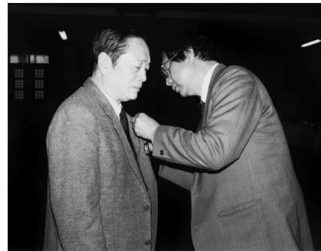
服務績優，榮獲中國文化大學董事長張鏡湖博士頒發獎章。