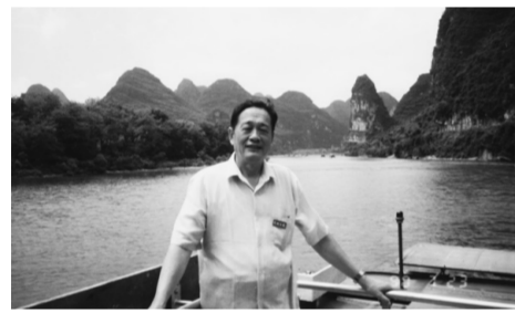
遊漓江，於渡輪上留影。