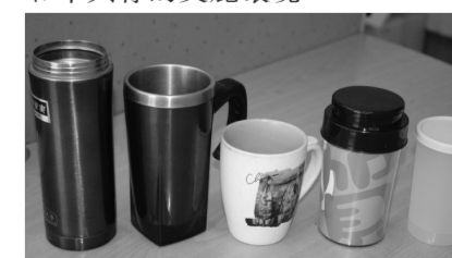
使用環保餐具與地球共生。

總務處近年來全力配合政府政策，包括推動綠建築、落實資源回收與垃圾減量，呼籲師生使用環保餐具、校園太陽能照明設備等，提醒全校師生共同響應節能計畫，落實心靈環保，打造一座健康美麗的文大校園。再次呼籲，教育就是落實環保觀念的重要一環，希望全校動起來，以環保大使為己任，創造一個與地球和平共存的美麗環境。