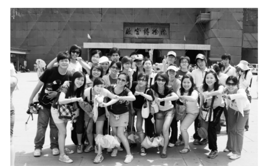
參訪自然景觀的雄偉刻畫，建築名勝的巧奪天工，加上人文氣氛的薰陶，給你不同凡響的充實選擇。

相關訊息可上： http://www.pccu.edu.tw/post/content.asp? Num=20071212114822555