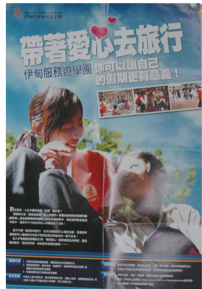
海外志工招募，培育華岡榮譽服務成員。

文大不僅重視同學課業上的學習，更致力培養服務人羣的精神，過去每年都會舉辦假期服務隊，足跡遍及全台灣，上山下海為弱勢兒童服務，透過舉辦各式活動希望提升當地教育品質，為國家未來的主人翁貢獻一份心力，也讓同學在付出中學習、成長。 而今年則首次舉辦海外服務工作，鑑於全球化的議題不僅展現現在政治經濟上，更體現在人道關懷方面，每個孩子都是地球未來