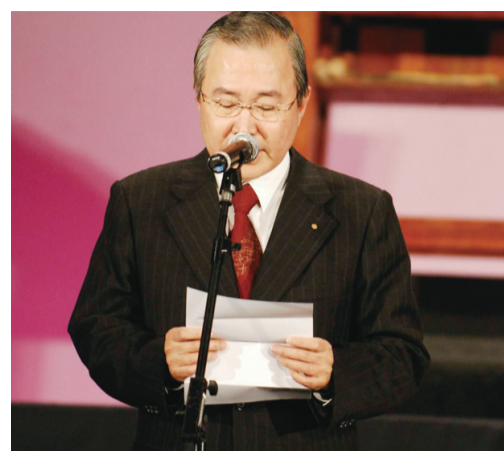
林劍理事長期盼文化創價友誼日恆長久遠。