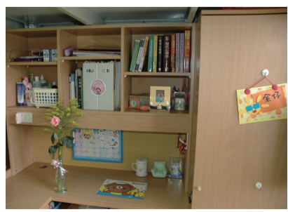
宿舍美化評比活動登場，評選整潔美觀與主體創

評審委員將由生應系、景觀系、學生宿舍各一名自治幹部擔任。評分方式包括室內外整潔、寢室內衣服、寢具等擺設，室內裝置陳列，整體創意等項目各占25%，評選出整潔美觀與主體創 意兼備之模範寢室。 為鼓勵同學盡心布置與熱情參與，將取各館總分前三名、共計十二間寢室頒給獎券。總分第一名寢室之同學各記小功乙次，並各發參百元圖書禮券一張，並可優先申請下學期住宿；第二名寢室之同學各記嘉獎二次，各發兩百元圖書禮券一張；第三名寢室之同學各記嘉獎一次，各發壹百元圖書禮券一張。 各館總分前三名之寢室，除了上述獎勵外，亦將於文化一週公開報導表揚，並擇期開放供其他同學觀摩，藉以達到相互學習之效。有興趣參加宿舍美化評比的同學，可至大恩館十樓生活輔導組洽詢，並填寫「宿舍美化評比」參賽名條即可。