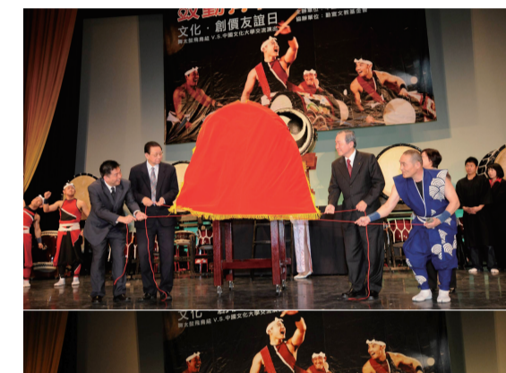
珍藏和太鼓揭幕典禮。