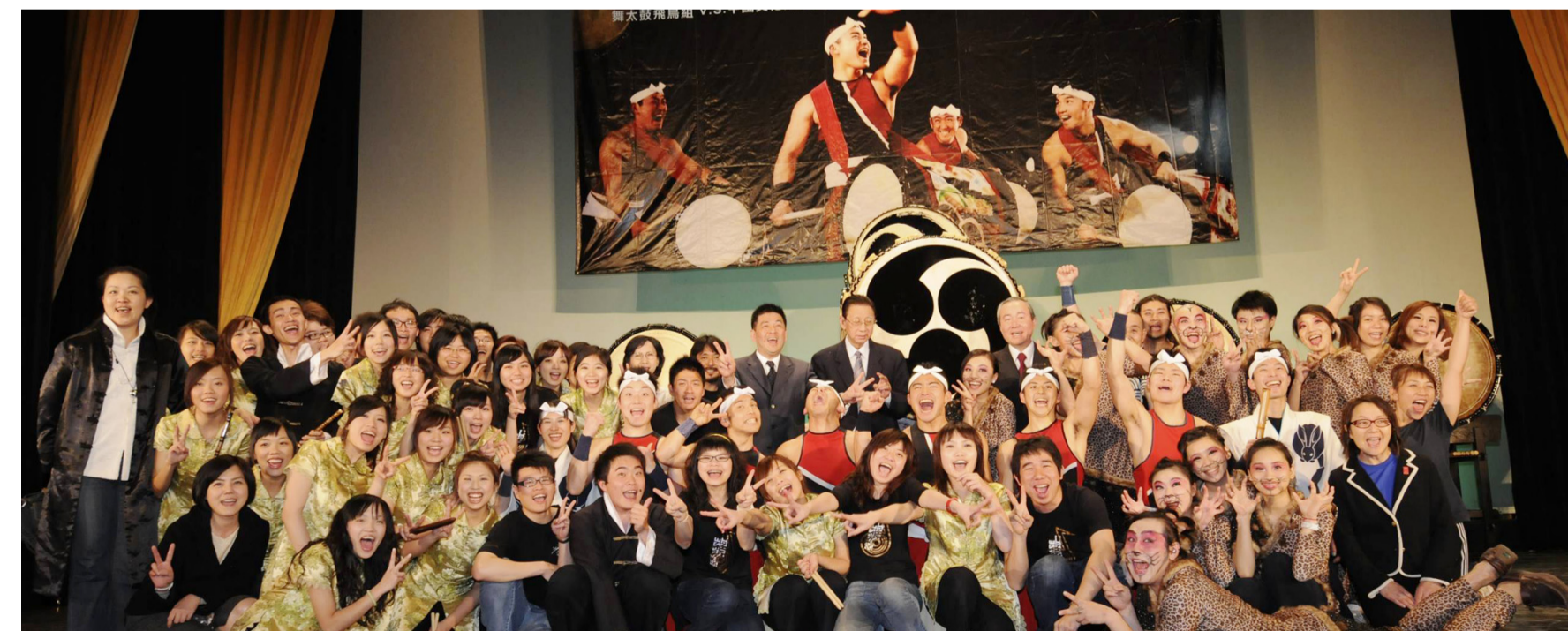
國劇系、國術系與國樂系三系聯合演出「三國演藝」與舞太鼓飛鳥組大合照

【文/李文瑜】見證歷史的一刻，敲打創價友誼美好日，3月24日於中國文化大學華風堂以「鼓動青春，舞踊華岡」為題，本校張鏡湖董事長以「珍藏和太鼓，見證歷史」感謝國際創價學會為文大帶來精彩的演出。張董事長說，這是一個教育藝術交流的美好時刻，唯有以藝術跨越國際界線，才可以讓藝術深植於教育裡，讓每個人都能在藝術領域裡享受最美好的感動。李天任校長致詞時則表示，本校以國劇系、國樂系與國術系合作的「三國演藝」，全新創意藝術詮釋藝術之美，為藝術教育無國界做最棒的示範。 張鏡湖董事長說，與國際創價學會創辦人池田大博士於日本知名教育雜誌《燈台》上連載的對談集「教育與文化的王道」即將順利完成，共同見證教育文化的未來，國際創價學會會長池田大博士指派享譽國際之日本「舞太鼓」演出，同時致贈「和太鼓」一座，對促進國際文化交流 與增進該