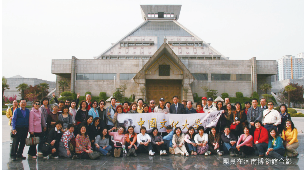
團員在河南博物館合影