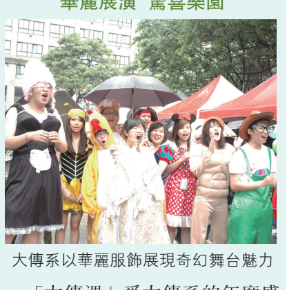
大傳系以華麗服飾展現奇幻舞台魅力