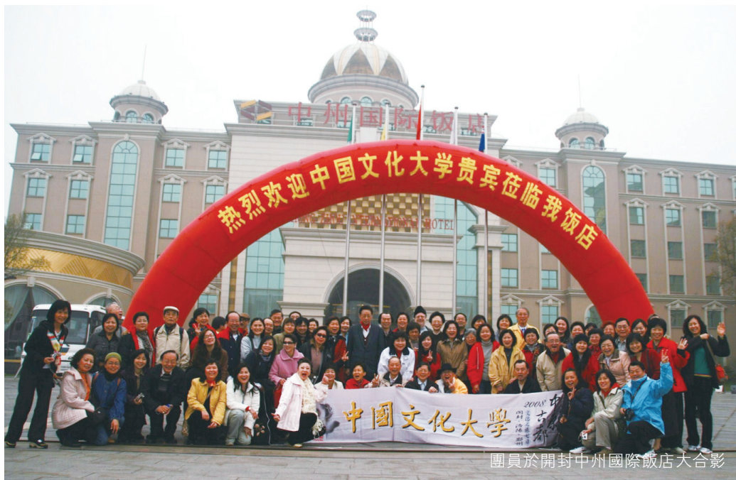
團員於開封中州國際飯店大合影

功，目前正在拼申遺，即聯合國教科文組織(UNESCO)所審定的世界文化和自然遺產，總數已達三十餘處，超越西班牙、義大利、法、德等國，成為世界十大旅遊國之一，而世界旅遊組織總部是否應從馬德里遷往北京？