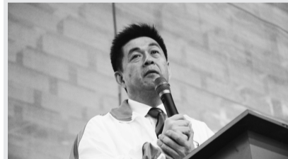
李校長希望每位代表隊員「挑戰過去-迎接未來」