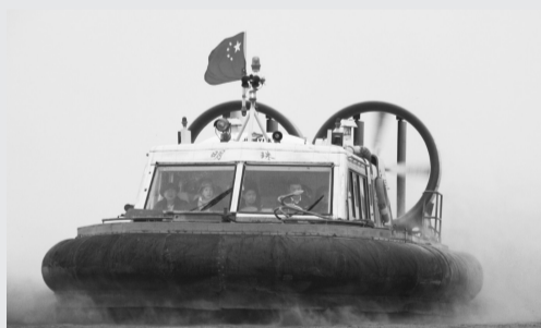
乘坐氣墊船遊黃河

四川省的人口原為中國第一，後因重慶改為直轄市，分出三千多萬人，遂使河南省躍昇首位（已達一億人），為民工輸出大省，故河南方言被當成民工語言，省長相當於大國總統。高速公路長度為中國第一，鄭州擁有亞洲最大的鐵路編組站和中國最大的零擔貨物中轉站。