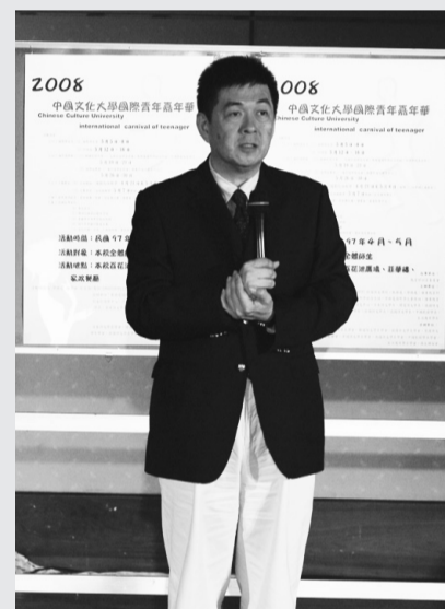
李校長歡迎僑生享受中國典雅之美