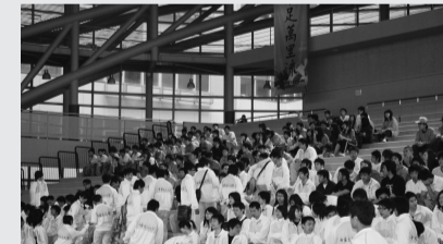
133位代表隊員身著中國文化大學代表服裝-「輝煌」騰達展翼未來