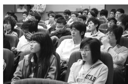
電機系學生聆聽大師分析