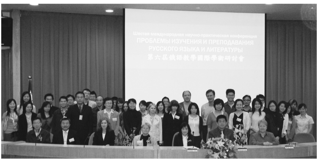
俄文系研討會會後大合影

俄國語文學系暨研究所4月26日在曉峰紀念館國際會議廳舉辦「第六屆俄語教學國際學術研討會」，李校長親臨致詞說，歡迎來自俄羅斯遠東科大、烏克蘭、大陸和國內各大學從事俄語教學、研究俄國語言、文學、文化和俄羅斯問題的學者專家，共聚一堂，發表論文。