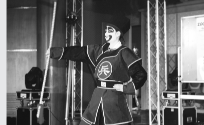
國劇系指導外籍僑生粉墨登場，融入中國傳統文化之美