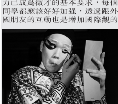
國劇系指導外籍僑生粉墨登場，融入中國傳統文化之美