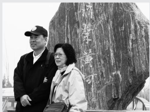
女警花現場示範防身術

清明上河園，英譯為“Millennium City Park”，係依照北宋張擇端的傳世之作《清明上河圖》為藍本建造，為一大型的歷史文化主題公園。團員竟說寡人的面貌像張擇端，打量大畫家的塑像，確有幾分神似，只是有些“cynic”（憤世嫉俗+憂國憂時）。「一朝步入畫卷，一日夢回千年」，園中有近二十項表演節目，所有員工均著宋服，猶如進入時光隧道，晚上尚有700餘人演出的大型