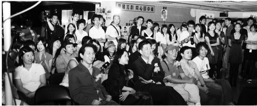
大傳系第12屆畢業熱鬧開幕