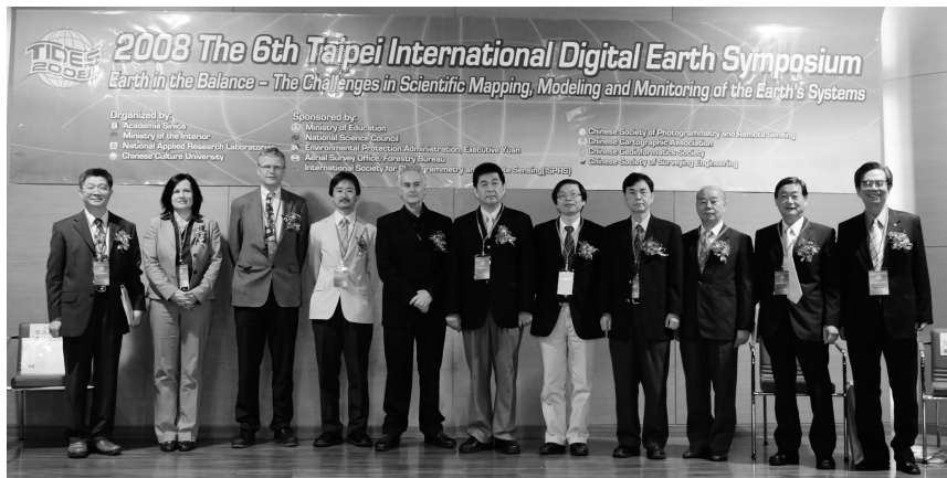
2008 年第六屆數位地球國際研討會蒞臨貴賓合影。

【文 / 李文瑜】2008 年第六屆數位地球國際研討會 15 日體育館開幕，首度網路直播連線的數位研討會，與華岡人同步見證科技新趨勢，展現高資訊時代，中