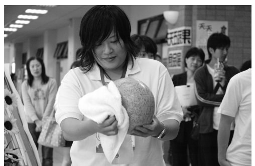
生應系透過「擦拭地球」的短劇詮釋對地球的愛