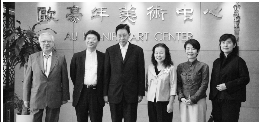
張董事長(左三)及歐豪年教授(左一)與王壽來參事(左二)等合影

歐教授作品曾應港、日、星、馬、歐、美各國美術館個展數十次，蜚聲國際，曾講學於美史丹佛大學、華李大學、夏威夷大學及印地安那波里大學。1990 年至 1991 年以英、法、德、奧、荷、比、西七國博物館巡迴展，載譽歐陸，旋獲台灣行政院新聞局國際傳播獎章。1993 年更榮膺法國國家美術當局，巴黎大宮博物館特別獎賞，為中國畫獲此獎之第一人。1994 年，榮膺大韓民國國光大學頒以榮譽哲學博士，及美國印地安那波里大學藝術學博士，被推崇為堅持東方人文精神之代表畫家。