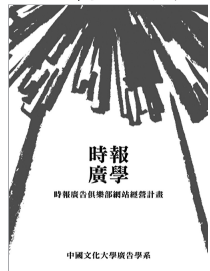
金犢獎金獎行銷企劃類作品時報廣學封面

【文/陳怡蓓】第 17 屆時報金犢獎頒獎典禮，文大廣告系以總成績二金一佳作名列全國第三！包括「時報廣學」與「美味牛頭」分別榮獲行銷企劃類及平面類金獎；另外，牛頭牌沙茶醬項之「台灣閩南戲曲系列-歌仔戲篇」同樣獲得佳作，為歷年參賽成績最亮眼的一次。