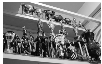
本校甲組棒球隊榮獲 97 年全國春季聯賽總冠軍，戰績 18 勝 4 敗。已經將近 5 年沒得冠軍了，陳教練說，這次的冠軍意義重大，未來期盼能夠加入更多棒球新血，讓棒球隊的光輝持續飄揚在華岡天空。

在比賽中選手們也有許多傑出的表現，如體育四林國民表現出的長打能力就讓陳教練稱讚不已，平均一場比賽 2 支安打，成為球隊贏球的關鍵。投手的壓制能力也是比賽不可或缺的，綽號「火球男」的羅嘉仁救援 16 局無失分，則是守住比賽的重點。