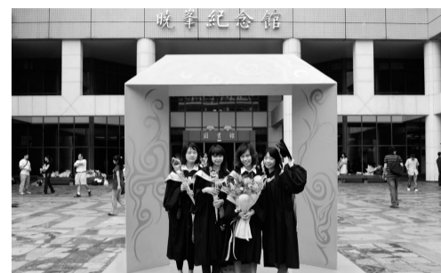
彩繪青春裝置藝術成畢業生最美的留影區

隨著隊伍緩緩前進，沿路上掌聲不斷，各學院院長陪同同學走過在華岡的最後一堂課，學弟妹們紛紛以最熱情的方式歡送即將離開校園的學長姐，以口號、歡呼、擁抱和送花等方式，為畢業生們許下最美好的祝福。