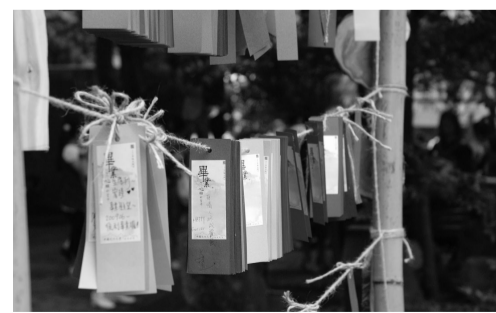
「終於解脫了，天理還在，嘿嘿嘿！」。助學貸款的畢業生則在祈望卡上許下心願，希望能將學貸趕快還清。

因逆境之粹鍊而堅韌沉穩；命運不是決定你的遭遇，而是決定於你看待遭遇的態度。」師培中心引用心靈靜思語的話語勉勵文大畢業生；新聞系蕭素翠老師以「是非當教育，讚美當警惕，謙卑當反省，錯誤當經驗」，希冀文大學生常懷感恩的心。史學系的準畢業生愛貓人開心表示，