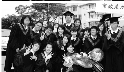
畢業生均把握在華岡的最後一日與昔日同窗合影留念

【文／葉子豪】96學年度「樂活華岡-卓越文化」畢業典禮重要傳統「校園遊園巡禮」，由張鏡湖董事長與李天任校長及12學院院長共同鳴起畢業吹奏曲，在國樂與管樂社的音樂聲裡，畢業生熱情揮舞，向曾經求學的殿堂鞠躬感恩。李天任校長說，畢業不是結束，而是另一個領先的開始，期許每一個畢業生勇往直前，邁向美好未來。