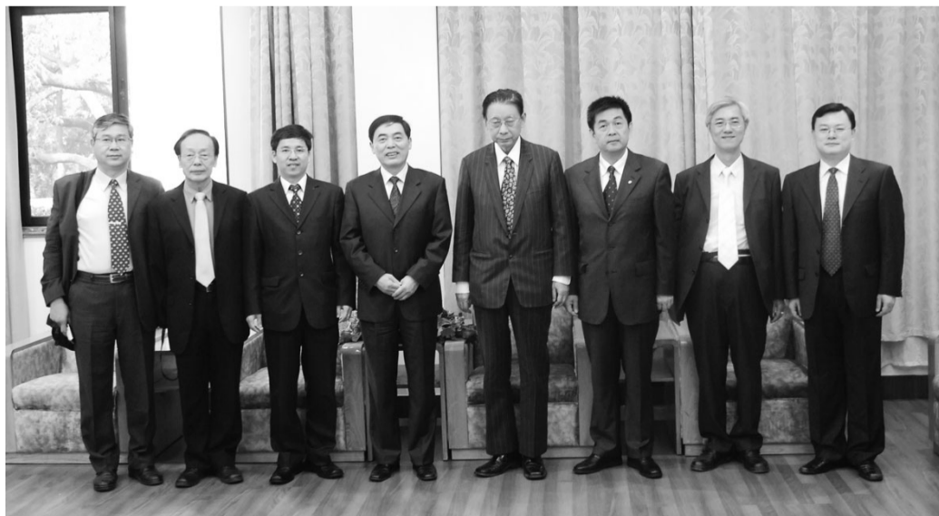
南大教授與文大學術交流團合影