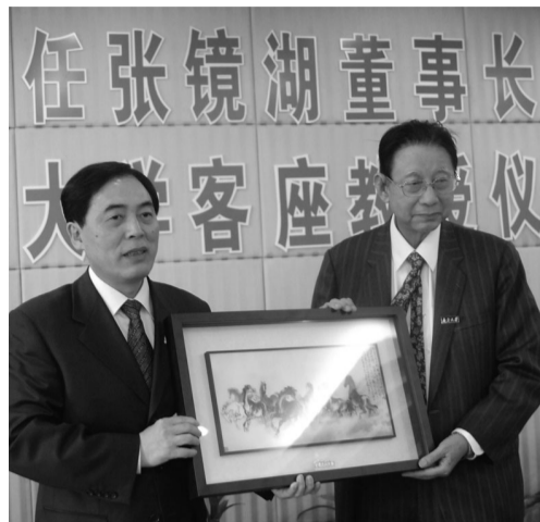
南大聘張董事長為南大客座教授