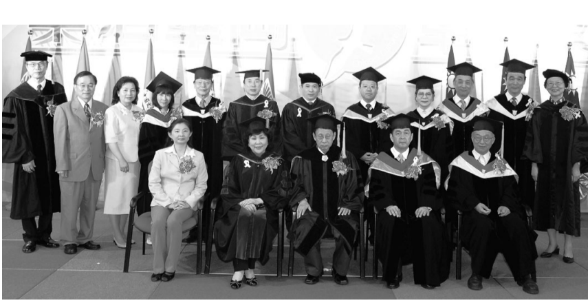
張董事長與華岡一級學術行政首長合影