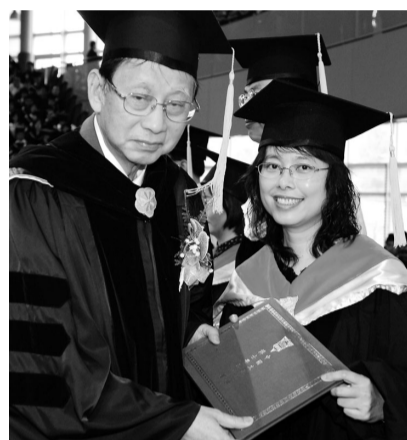
張董事長頒畢業證書予博士班學生