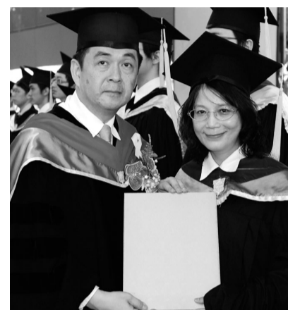
李校長頒畢業證書予碩士班學生