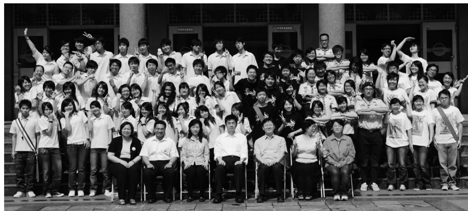
服務隊出發！合影展現熱情

本次授旗暨頒獎名單包括華岡社會服務隊、同濟社會服務隊、崇愛社會服務隊、嘉義縣市學友會返鄉服務隊、高雄縣市學友會返鄉服務隊、雲林縣市返鄉服務隊、金門縣市返鄉服務隊、南投縣學友會返鄉服務隊、國際志工團心苗計畫服務隊，每隊皆獲得象徵服務精神旗幟一面、加菜金1萬元以及文具補助金1,200元整。