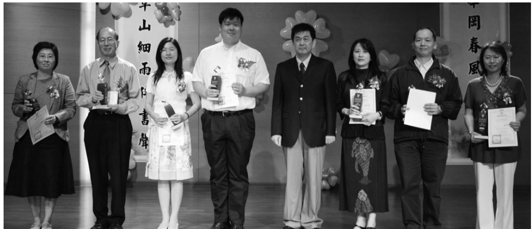
李校長與環設學院、新傳學院績優導師合影

教師們可以將教材上傳至網路平台，拓展教學空間的好方式，但需注意智財權問題，學務處將會提供各種智財權的問與答，歡迎老師們多多運用。