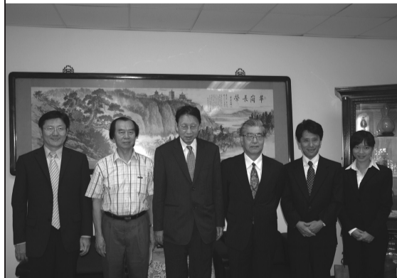
張董事長(左三)田浪和生教授(右三)與貴賓們合影

做跨領域結合外，同時藉跨領域結合和學生交流，共同培育具有多元國際觀的專業術科人才。