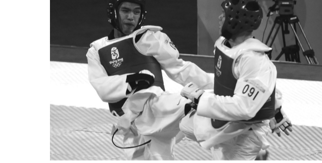
宋玉麒於北京奧運拿下銅牌後興奮與父親宋景宏合影

於北京奧運回國後首度拜會張鏡湖董事長與李天任校長，並將在奧運場上獲得的銅牌與華岡人分享台灣奧運之光。宋玉麒老師表示，「人要成功，就是要忘掉自己，盡情發揮潛能在力量，在奧運場上和對手一決勝負時，心中不要有其它想法，盡可能的忘掉一切。唯一肯定的只有一件事情，就是要打敗眼前對手。」正因為抱持這種心態，宋玉麒老師在最後一場參加奧運賽場上，發揮了百分之百的實力，為台灣贏得銅牌獎座。