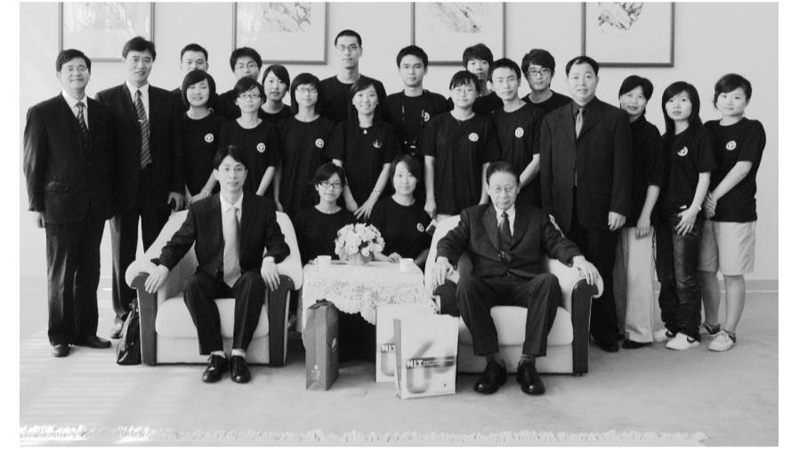
張董事長與浙江大學寧波理工學院師生合影

學長，對浙江大學有很深的情感，文大近幾年來推廣兩岸交流有很好的成績，包括舉辦各種大型的學術研討會及兩岸學生交流研習營，均是領先全國大專院校