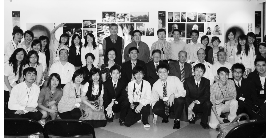
張董事長與策展師生合影