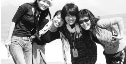
炎熱的天氣令人睜不開眼，但美麗的海灘仍令人紛紛留下倩影