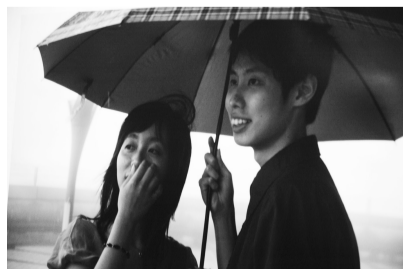
情侶是鏡頭裡最美的浪漫

《文大校訊》為您掌握校園動態。歡迎前往大恩館二樓公關室前走廊、圖書館櫃檯或大雅館、大慈館櫃檯索取。