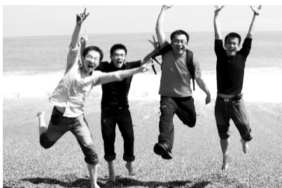
湛藍海水，令大陸生情緒昂揚