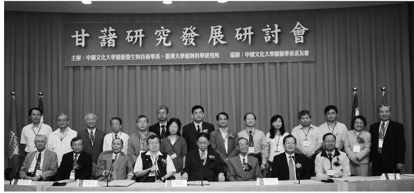
張董事長與參與貴賓合影

張董事長說，糧食已成為全球的重要課題，大陸將甘藷的研究拉高至國家合力推動研發的重要研究，但台灣卻往往將這樣的研究置之不理，相當可惜，甘藷是台灣近幾年來相當火紅的健康保健食品，如能將其生態科技融入種植與食用的觀念，相信以這樣的產品，將成為提升台灣農產市場的重要角色。