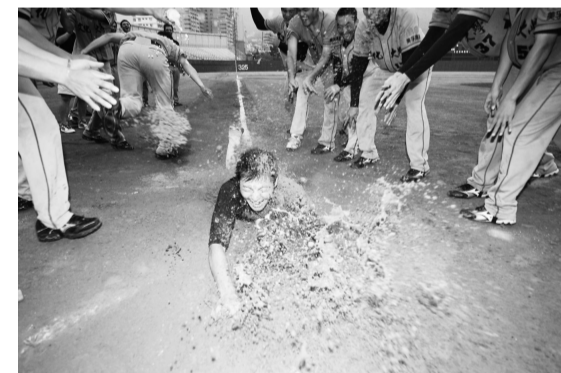
慶祝三連霸球員慶祝