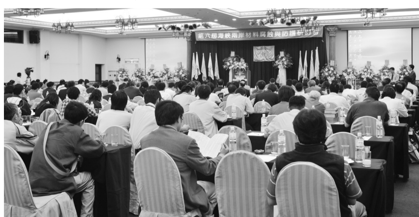
「第六屆海峽兩岸材料腐蝕與防護研討會」總計發表上百篇論文

材料所教授並提到，若是在合金中添加不同莫耳比的硼元素時，可以有效提升其耐磨耗能力，此種合金被命名為多元高熵合金，希望藉由此一新觀念來突破傳統合金設計的瓶頸。