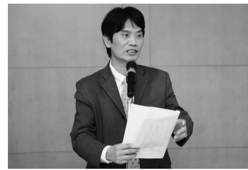
施登山總務長期盼空間變革，創師生更高福利

【文 / 李文瑜】97 學年度第一學期總務會議 19 日舉行，營造校園建築整體觀，今年營繕組積極整修擴展教學研究及行政支援空間，總計完成 10 館樓 12 學院 429 間獨立教授研究室的裝修工程，提供全校專任教師獨立教學準備、