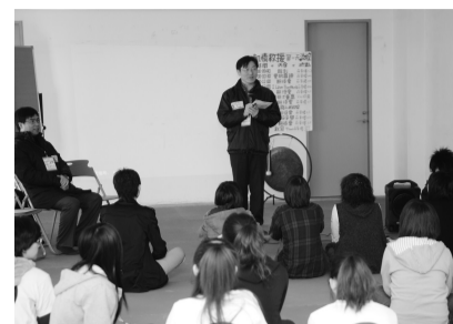
林柏杉學務長率先體驗「饑餓三十」的活動