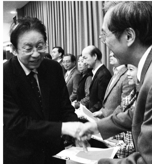
張董事長——與主管握手合影

為讓學生更具國際觀，自 97 學年度新購 Live ABC 之電腦輔助教學系統 - 英語精修數位學習 (Elite English)，做為原 Tell me more 系統之替代方案，目前正提供本校研究所碩博士班學生使用，通過相關測驗後可抵免密集英語聽講課程，頗獲學生與老師好評。