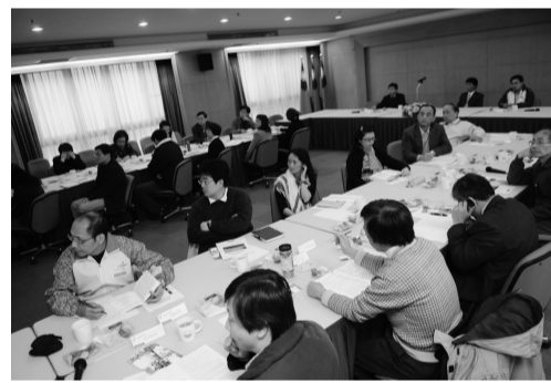
總務會議聆聽各主管簡報

【文 / 李文瑜】97 學年度第一學期總務會議 19 日舉行，營造校園建築整體觀，今年營繕組積極整修擴展教學研究及行政支援空間，總計完成 10 館樓 12 學院 429 間獨立教授研究室的裝修工程，提供全校專任教師獨立教學準備、