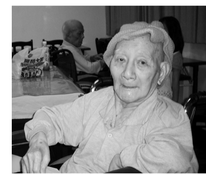
樂恕人老師是中國最早的廣播記者