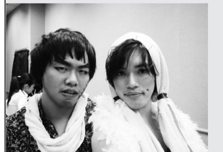
裝扮逗趣的角色是康樂人才重要的課程