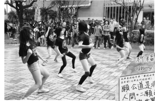
勁舞展現青春活力

今年華岡冰雪節更顛覆傳統觀念，現場提供冷冰冰的「華岡冰棒」，供學生免費享用，一推出吸引大批前來挑戰的學生，大排長龍吃冰情景成為華岡最特殊的情景。為能感受最真實的寒冷聖誕節，現場以華岡特有的雪花機製造成冰雪節之氣氛，讓學生們感受雪天的情境，吃喝玩樂後，社團的演出齊聚許多學生，包含熱舞社的熱情地板舞，國樂社的傳統典雅樂曲，而華岡交響樂裡演出，更讓百花池成為國家音樂廳，一曲曲震撼音樂的樂曲，一首首動人的個人長笛與鼓聲的獨奏，讓許多華岡人難忘華岡冰雪節的好氣氛。