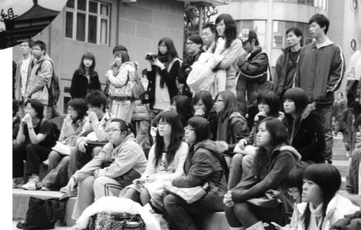
百花池聚人氣 迎接2009年新未來