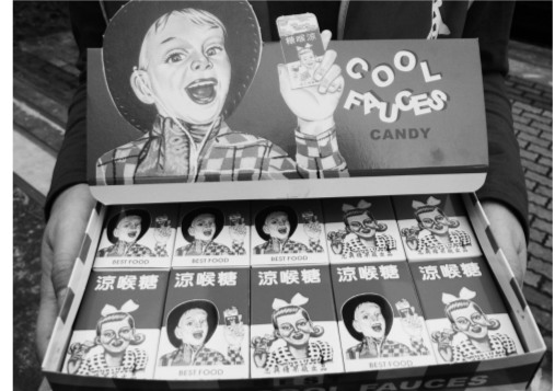
吃個涼喉糖，少抽菸