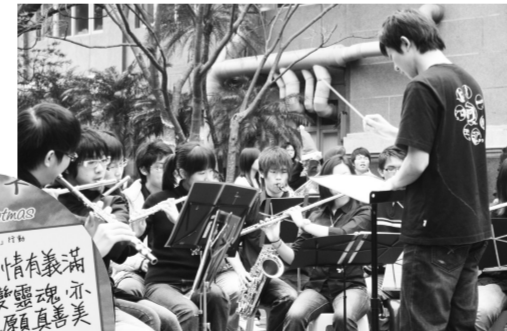
交響樂團吹奏新年新希望