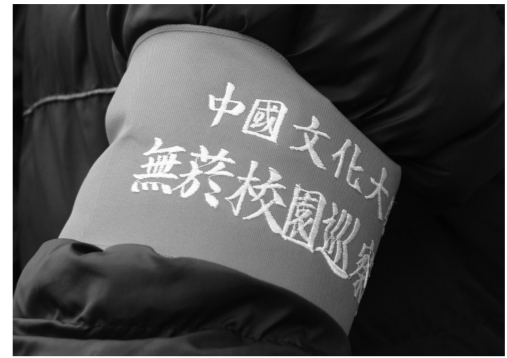
肩膀的紅領巾是宣誓禁菸的決心