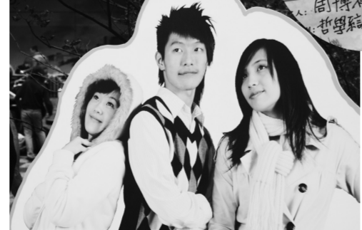
華岡冰雪節代言人立牌，不少學生與之合影