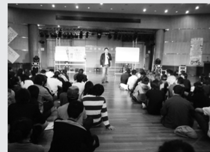
邀請專業級老師授課

【文/蔡怡琳】97 學年度第 31 屆康樂輔導人才研習訓練營共分三梯次舉行，今年由華岡康輔社主辦，華岡嚶啞啞及海天青協辦，藉由四天二夜的康樂輔導人才研習活動，培訓華岡康樂人才，推廣康樂輔導精神於華岡學子之中，藉由活動與課程實際感受康輔活動的趣味與意義。