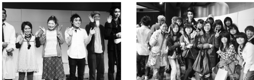
參與第八次來台日劇演出「側耳傾聽」的全體演員