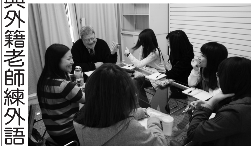
觀光系外語能力加強班學生上課情形

本次外語能力加強班，於各時段分別開設13門不同課程，並考量學生外語程度不一，課程開設基礎班與進階班。報名時間自即日起至三月四日止，每班至多招收十名學生，名額有限，有興趣的同學儘快至大恩館955產學旅行社報名。詳情請上教育部補助觀光服務特色領域人才培育改進計畫網頁查詢。