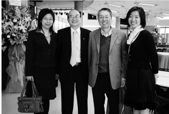
宏碁(Acer)董事長施振榮在體育館聆聽曼陀林演奏，後與本校傑出校友聯誼會何和明會長等人合影

現任智融集團董事長、宏碁(Acer)董事、明碁(BenQ)董事、緯創資通(Wistron)董事、台積電董事、亞洲企業領袖協會(Asia Business Council)會長。出生1944年出於台灣鹿