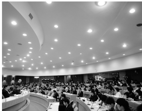
第三屆池田大作先生座談會吸引許多師生聆聽

理念，更是感謝中國文化大學給自己的機會，這15年來，日本創價大學與文化大學堅實的友誼，已不斷在中日杏