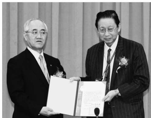
張董事長與日本創價大學山本英夫校長合影

【文 / 李文瑜】第三屆池田大作和平思想研究論壇「人本主義與和平共生」研討會在三月陽明春曉的初春在晚峰紀念館國際會議廳舉行，邀請春天的使者—日本創價大學山本英夫校長一行，代表創辦人池田大作先生的深情厚意，蒞訪文化，祝賀華岡創校47周年校慶，商學院林彩梅院長，亦為國內第一所在台灣設立池田大作研究中心主任強調，值此全球陷入金融危機，人心不安，期盼透過全球論壇講座，為世界和平與人類幸福，貢獻最大的心力。