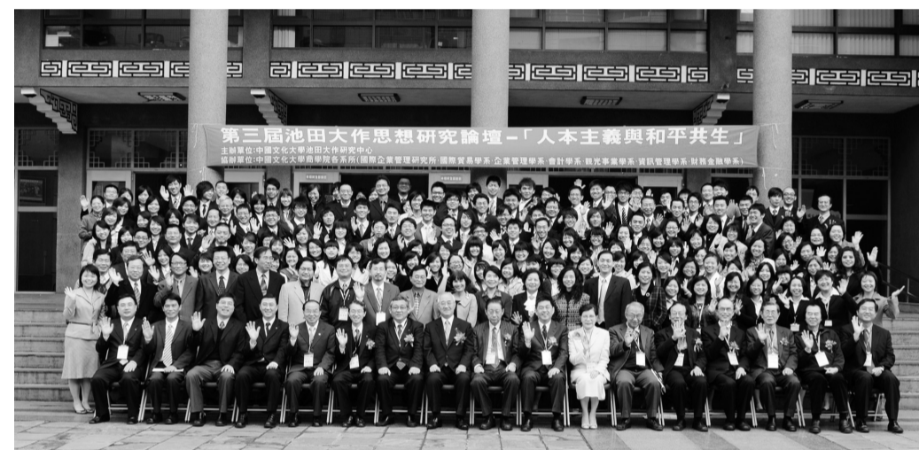
日本創價大學貴賓與本校師生合影

理念，更是感謝中國文化大學給自己的機會，這15年來，日本創價大學與文化大學堅實的友誼，已不斷在中日杏