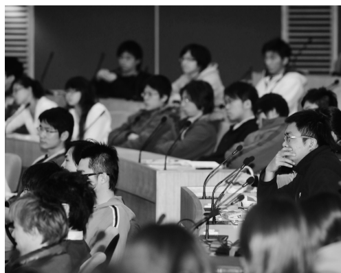
聆聽科技明日校園論壇聚精會神的師生