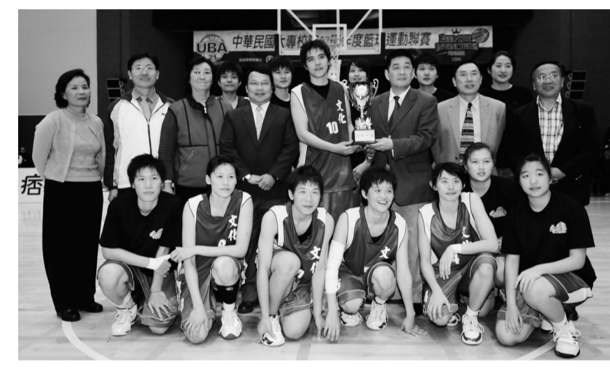
李校長與女籃冠軍合影