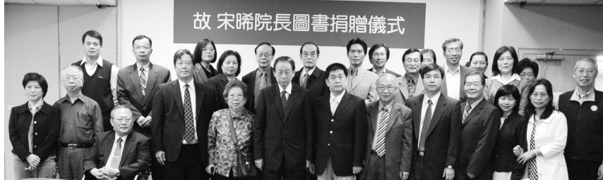
張董事長、李校長與宋師母與本校見證捐書典禮的教職員合影