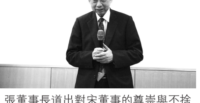
張董事長道出對宋董事的尊崇與不捨