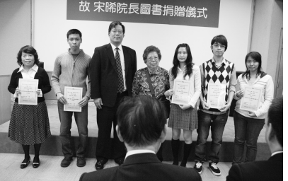
張董事長、李校長與宋師母與本校見證捐書典禮的教職員合影