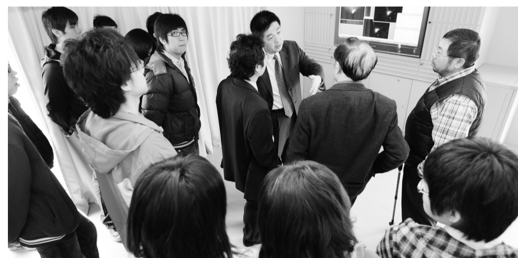
百萬元天文觀星設備位於體育館十樓，透過網路自動操控，即可自動追隨星象之途徑。