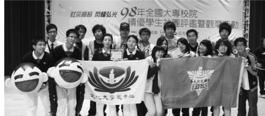
學生會(上圖)與慈濟青年社(下圖)雙雙獲特優獎