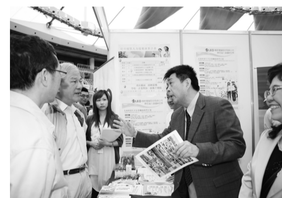
李校長分別向馬總統、劉院長及鄭部長報告「畢業生至職場實習方案」，並賣力宣傳文化大學之美

【文/郭瓊俐】「2009北區就業及人力加值博覽會」4月18日在桃園縣立體育館舉行，本校現場設置攤位，進行多項方案的徵才活動。馬英九總統及行政院劉兆玄院長親自到文化大學攤位，聽取李校長講述本校執行「畢業生至職場實習方案」的情形，對李校長的報告十分滿意。本校是馬總統及劉院長在所有北區大學設置的攤位中，唯一到訪的學校，足見馬總統與劉揆的重視。