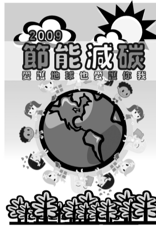
優選 - 市政碩江松剛

球暖化」與「氣候轉變」這兩種現象將會影響我們、我們的家庭以及我們所處的環境。此外，身為全球公民的一份子，我們要立即處理此事，讓地球逐漸冷卻下來，我們不能只是靜靜的等待政府部門來處理，她強調，所有的人都需要負起責任，做我們每一個人份內所需要做的事，本周將是「華岡校園地球週」，是中國文化大學畢業宣言的一個活動，由本校一群教師與學生在學校內對教職員以及學生全體倡導對社會與環境所需盡的責任。