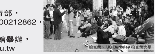
柏克萊 - UC Berkeley 柏克萊大學

哇！這麼豐富的暑期遊學怎能錯過？更多的遊學資訊請洽中國文化大學推廣教育部，電話：02-27005858 分機 8581-8586 / 0800212862，EMAIL：hschs@sce.pccu.edu.tw 每週三 12 點 -5 點，校本部說明會於大忠館舉辦，線上預約：http://studyabroad.sce.pccu.edu.tw