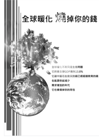
佳作 - 市政四簡曼如