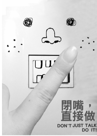
佳作 - 廣告二高郁榮