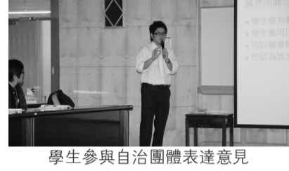
學生參與自治團體表達意見