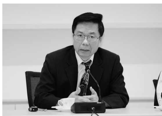
何志明院士邀大家領導變化