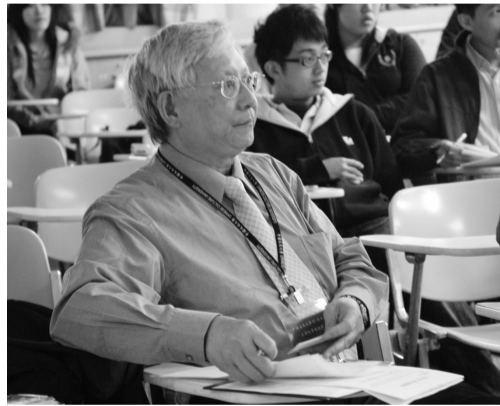
評審團聆聽專題組報告

【文 / 蔡怡琳】激發創意思維與科學潛能，工學院舉辦「工學院專題競賽」進入複賽，於 4 月 29 日在大義館 319 教室舉行，同時是工程週重點活動之一。今年專題競賽分為「論文」與「實作」二類，由學系辦理預賽，推薦優勝者進入複賽，期間參賽隊伍需將作品陳列展示及測試，並現場解說示範。