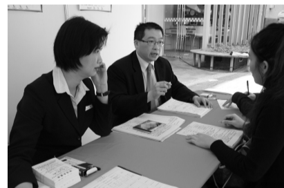
參展單位派出人事主管單位親自坐鎮