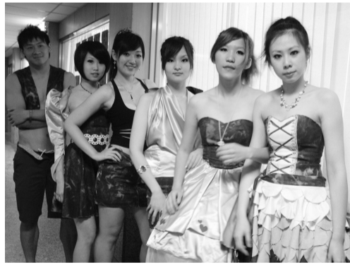
實作組特別邀請系上同學擔任模特兒，透過伸展台走秀方式展現自己設計的服飾

「實作組」共有 9 組進入複賽，紡織系「創意文化應用於織品設計」專題，當天特別邀請系上同學擔任模特兒，透過伸展台走秀方式展現自己設計的服飾，融合澎湖的海洋、岩石等色彩與環境元素，讓服飾擁有不同的風格，其中，一秒鐘可將外套轉換為包包的創意作品，也獲不少好評。