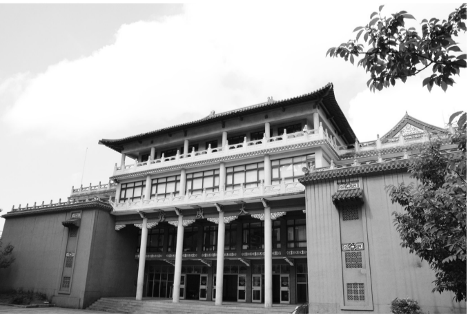
孕育高信疆學長的搖籃 - 文大新聞系