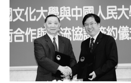
才，兼融中華文化傳統的決心與努力；當年本校突破萬難，領先全台灣各大專院校首次邀請大陸學者—中國科學院陳述彭院士蒞臨華岡演講，並頒發榮譽博士，獲得國內極大迴響。

中國人民大學校徽是以三個並列的「人」篆書圖形組成。三個「人」字分別寓意「人民、人文、人本」，即「人民的大學」、「以人為本的精神」和「以人文為主的特色」，以提升中國人民教育為使命。李校長則提到，本校是以「木鐸」意形而成，象徵傳承教育的精神，兩校對教育的堅持與理念一致。 李校長也提到，在大陸名為「繼續教育」，在台灣則稱「推廣教育」，本校排行第一名，在此一領域深耕長久，每年均有超過五萬人次進出學習，具相當大規模的學習流量，目前已在大陸設有據點，希望兩校可以針對此一領域合作推廣，為兩岸的教育體系開啓另一個新的領域。 中國人民大學程大權校務委員會主任則提到，在台灣接軌的第一份校刊，就是「文大校訊」，其中，介紹文化大學與韓國大學互動往來的新聞，與學生會獲全國社團特優獎，都讓人覺得這學校的活力與對教育的培養用心，未來希望在簽訂姐妹校後，能夠面向世界的企圖心，共同提升兩岸教育。他舉例，一顆蘋果兩人吃，一人只能吃一半，但知識蘋果一顆卻代表無窮無盡的學習力道，兩人吃可以吃到很多很多的，意義非凡，希望兩校可像知識蘋果般，兩兩相乘，創造極強的合作影響。