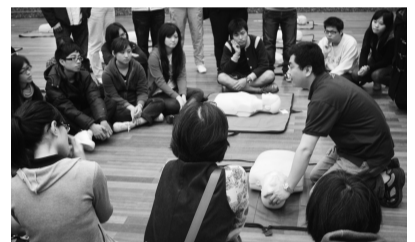
心肺復甦術的操作與急救

廣協會合辦急救營，是為讓全校師生遇到急難時，可以自救與救人，並能了解生命之鏈的各個環節、判斷正確的時間打電話給119等，透過專業的訓練，降低遺憾的發生。 今年的急救營課程包括，心肺復甦術簡介及心肺復甦術講解和示範，並透過分組教學方式，解決如發生異物哽塞的緊急處理方式。此外，課程並融入簡易身體評估之講解、示範與操作、止血之講解、示範與操作、包紮之講解、示範與操作。 固定與搬運之講解、示範與操作，這些課程均為急救中相當重要的環節，透過學習與操作，讓急救的觀念成為平常裡最重要的訓練。