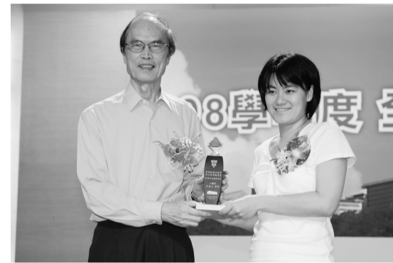
教育學院歐陽院院長頒發績優導師