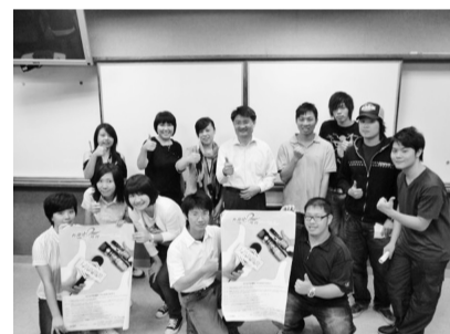
TVBS 工作人員與文大新聞系一同為大學新聞獎宣傳

間，也是訓練新聞系學生培養正確採訪態度，和運用所學的最好平台，讓充滿生命與關懷的新聞報導提高能見度，使社會充滿溫暖的正向力量，感受台灣人擁有的包容、努力、樂觀和融合等精神，帶領閱聽人從「心」感受新台灣。