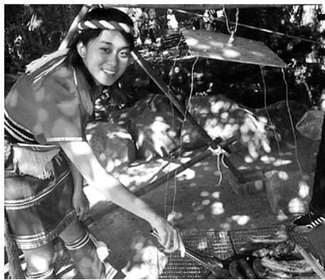
原薪社積極傳承原住民文化

而在積極參與表演活動之餘，原住民文化傳薪社也發揮互助精神，除利用平常社課的時間，透過彼此提攜解決原著名青年在日常生活和課業上的疑難雜症，也經常舉辦社團活動，以凝聚社團成員感情，讓原住民文化可藉草山青年彼此的相互扶持。