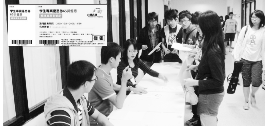
學生於大恩館 10 樓排隊兌換高鐵優惠券，可換購不限乘車區間之 65 折車票。

持優惠券所換購之車票乘車時，需攜帶本人有效之學生證以備查驗，進入驗票閘門及列車上將抽驗學生證，未持本人之有效學生證者應照章補票，並得加收票價差額之百分之五十。