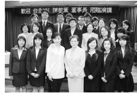
陳敏薰董事長與國企所師生合影

【文／蔡怡琳】台北 101 前董事長陳敏薰 10 月 6 日應商學院國際企業所邀請，在大恩館 1 樓國際會議廳，主講「從開發金控到 101—陳敏薰的精緻差異化策略」，暢談處理 101 危機的關鍵對策。她自信地說：「唯有面對接踵而至的困境，才能化解危機，如今 101 走過資金困窘、風水之說及說不盡的危機，而今則化身台北人的驕傲，書寫台北人的故事，成為台灣人及國際間的共同印象。」