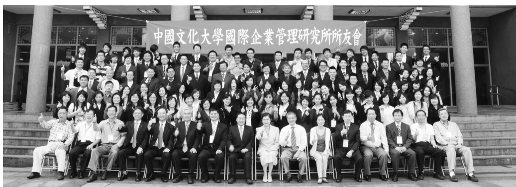
國企所校友回娘家齊聚大成館留影