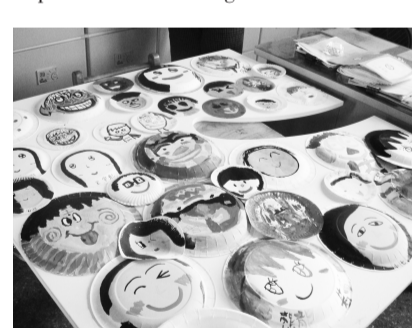
文大廣告系帶領學童發揮創意

廣告人歷經長時間工作，當初進廣告園的熱情往往被忙碌的時光壓縮，台灣廣告節本次開創「微笑創意學堂」，希望廣告人在忙碌之餘不忘積極投入社會公益，由廣告公司及廣告系學生帶領國小學童發揮創意，激盪出主