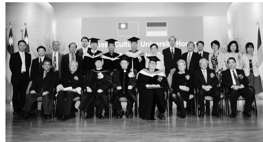
頒授名譽博士後合影

【文/李瑜瑜】本校於11月10日頒授德國慕尼黑大學榮譽教授彼德·巴杜拉先生名譽哲學博士，在體育館八樓柏英演藝廳舉行。張鏡湖董事長致詞時表示，彼德·巴杜拉先生是本校首次頒發德國籍名譽博士，已指導之博士生超過三百餘人，桃李滿天下，於法界學術貢獻深，相當高興頒授彼德·巴杜拉先生名譽哲學博士學位。