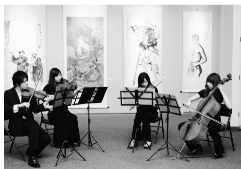
華岡音樂響宴校友聆聽