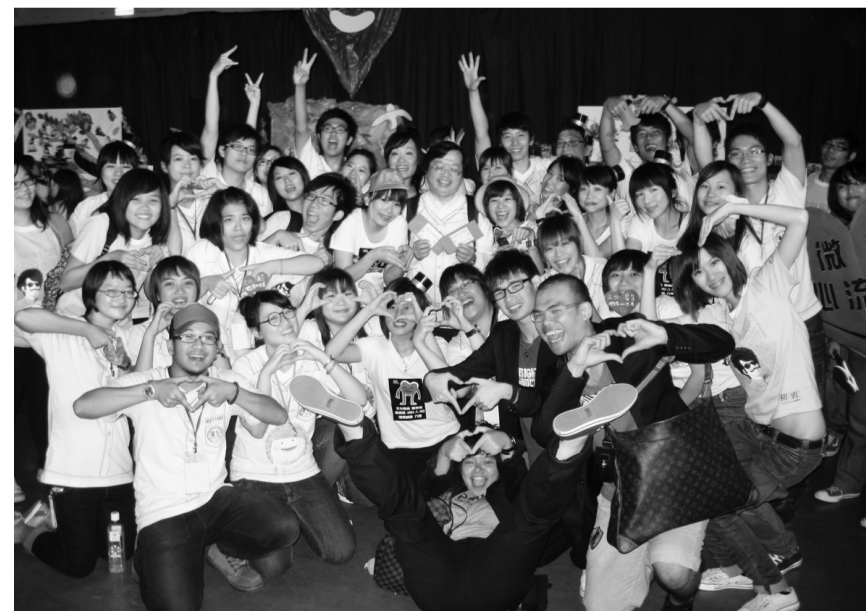
台灣廣告節喚回廣告人熱情