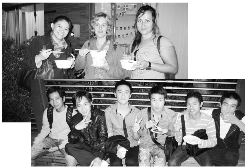
外籍生於菲華樓前享受溫暖和風

異國情調，讓外籍生留下深刻印象。「國際烤肉聚會」特別邀請楊泰順校長、陳虎生主秘及國際交流中心等貴賓出席與外籍生對談，現場並提供道地的蒙古烤肉、精緻的沙拉甜點以及趣味性的遊戲，讓每位參與會員在舒適的氣候、輕柔的音樂與歡樂的氣