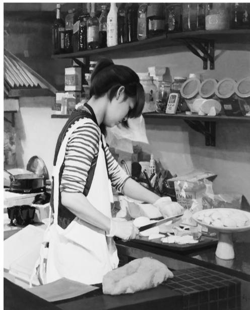
李嘉睿創作 幸福的角落