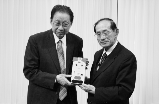
張董事長接受林董事長大同實質禮物