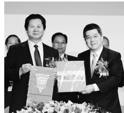
本校楊泰順校長與河南大學校長婁源功(前左)簽訂學術協定

【文／李文瑜】「中原文化寶島行」台豫高校學術交流合作簽約典禮」於17日舉行，本校正式與河南大學校長婁源功簽訂合作協定。張鏡湖董事長說，以中國文化為名，兩岸師生將積極互動，加強兩校學術交流、教職員交流與學生交流，對於兩校所關心的領域及議題，進行共同研究與資訊交換等交流合作，譜寫雙贏的未來。