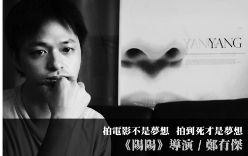
拍電影不是夢想 拍到才是夢想 《陽陽》導演 / 鄭有傑