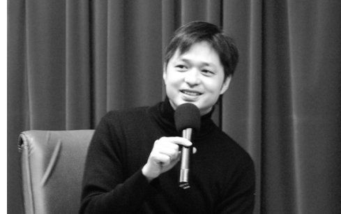
鄭有傑導演分享電影創作心情

【文 / 蔡怡琳】投身電影圈的無悔熱情，大傳系系學會與大傳青年組織合辦「影視專題演講」，12 月 14 日國際會議廳，邀請《陽陽》導演鄭有傑，主講「創意與說故事的導演功課」，分享對電影產業的觀察及創意之道，超高人氣吸引現場爆滿觀眾。