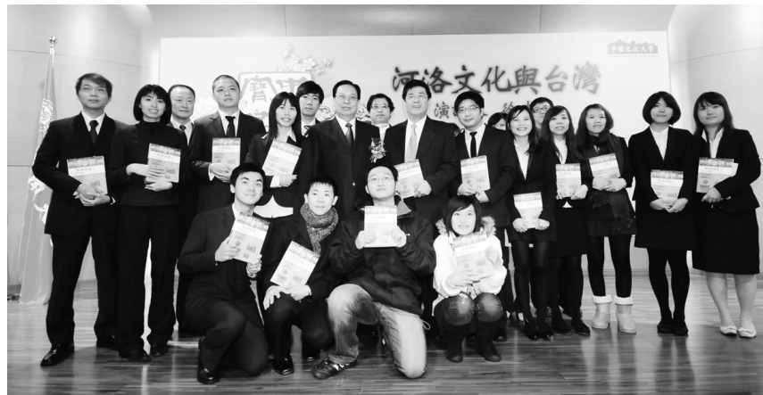
參與推動兩岸交流的師生合影