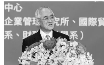
日本創價大學山本英夫校長出席盛會