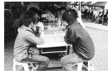
象棋社邀請各方好手踴躍挑戰