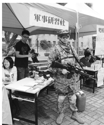
逼真槍械吸引同學目光

《文大校訊》為您掌握校園動態。歡迎前往大恩館二樓公關室前走廊、圖書館櫃檯或大雅館、大慈館櫃檯索取。