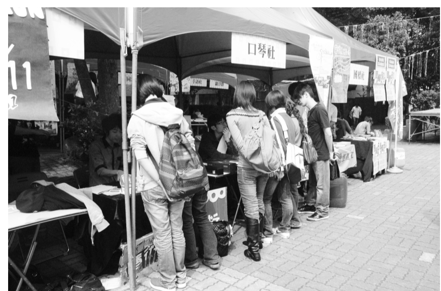
社團招新人潮踴躍