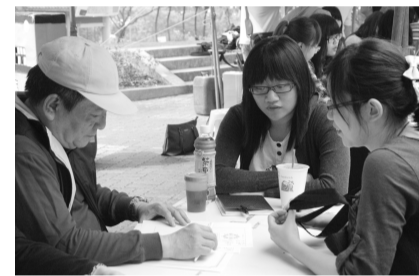
命盤老師免費為學生算命