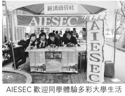
AIESEC 歡迎同學體驗多彩大學生活