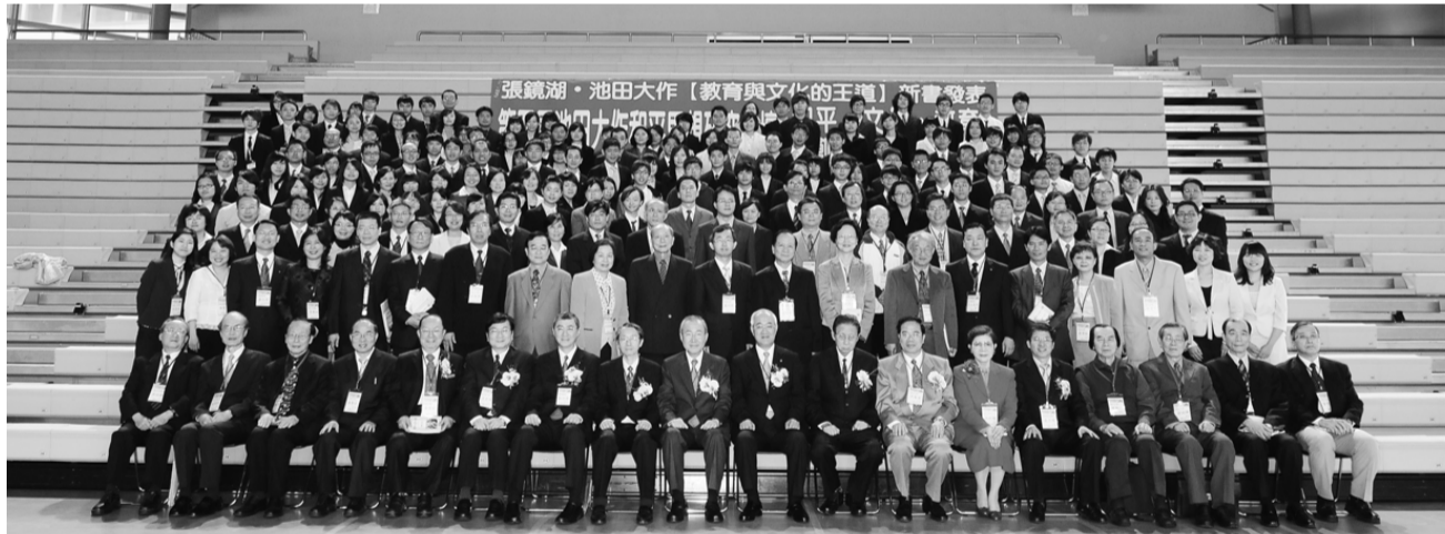
參與第四屆池田大作先生和平思想研究論壇貴賓合影

校園裡有19世紀法國雕刻家製作的一對「天使與鐵匠」青銅像，上面刻著「唯有勞苦與使命中，人生才有價值。」以及「諸君勿忘為何磨練英知、睿智。」這兩句話，殷切期勉各位，一定要成為貢獻社會、為民衆謀福利的一流人才。主辦第四屆池田大作和平思想研究論壇-商學院林彩梅院長則提到，在全球化時代裡，多國籍企業必需面臨全世界各地不同資源、領導、顧客、子公司及同事等更劇烈的競爭，企業需以和平文化的思維基礎建立經營制度，維繫企業經營的根基，落實池田大作先生推廣之和平思想深刻觀念。