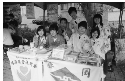
服務精神充實大學生活

創辦者張其均博士曾說：「社團是大學生命線」，成為華岡豐富的社團文化最佳註解。跨越科系界限，與理念契合的同學彼此學習成長，從中可培養領導能力、團隊合作和表達能力，由另類課堂學習啓發獨特價值，如同雨水澆灌種子，讓大學生涯持續發芽茁壯。課外活動指導組每年還有「社團總體評鑑」，優選社團將可獲得表揚榮譽。