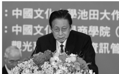
張董事長介紹池田大作先生和平思想