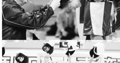
女籃拿下三連霸勝利