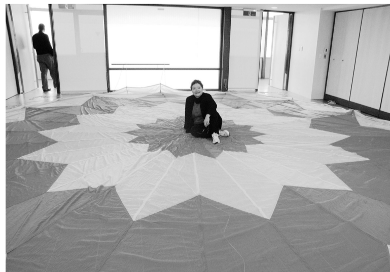
大型降落軍用傘徵求追風箏的孩子

她提到，藝術裡唯有無價，突顯藝術裡的質感，正如歐洲處處都是藝術，一個窗框，一片地磚，在渾成的自然天地空間中，營造自然藝術的氛圍；近年來，在中國文化有價藝術的興起後，隨之而來的有價的商品，而這些已形成商品的價值，已經脫離藝術生活的範疇，反倒成爲收藏家，而非藝術家。身爲文化大學的學生，擁有得天獨厚的自然渾成的藝術環境，就該好好培養藝術者的觀賞氣質。