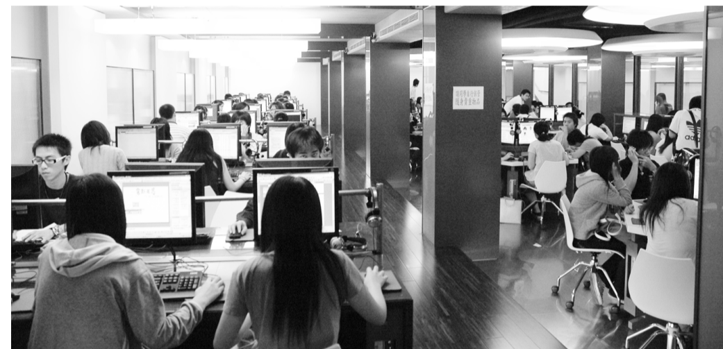
資訊中心營造全方位資訊人學習環境

影響就越大，校園達人計畫讓我們的資訊服務志工踏出成功的第一步，我們的經驗也將成爲學校未來全面推廣服務學習的重要參考。」