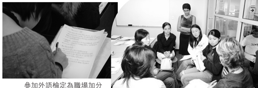
參加外語檢定為職場加分 最高 5000 元獎金鼓勵同學勇敢學外語

其詳細申請資格可看： http://www.pccu.edu.tw/post/content.asp?NUM=20100329113217344