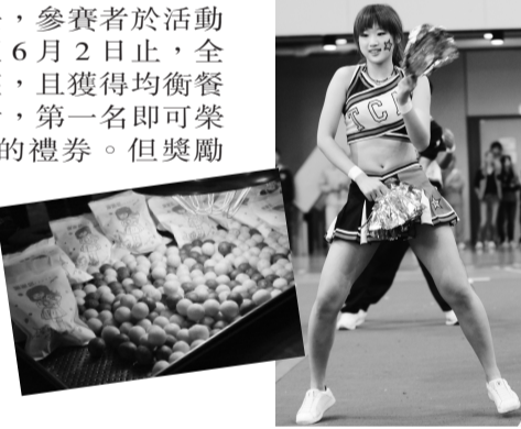
均衡飲食、適當運動維持窈窕身材

衛保組強調，由於現代人因工作繁忙，三餐多半在外食用，離家求學的學生更是如此，為了求方便，導致飲食習慣不正常，進而影響到身體健康。舉辦此活動是希望藉由本校師生從日常生活培養起均衡飲食的概念，機會難得，邀請師生踴躍參與！