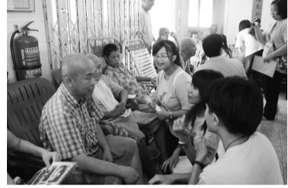
服務社區老人、幫助社區落實資源分類

【文 / 謝羽青】暑假如何規劃？經濟商管社 AIESEC，2010 年暑假海外 6 至 8 週海外成長計畫，帶你一起為大學生活劃下驚嘆號！4 月 7 日晚上 6 時 30 分，於大恩 502 教室舉辦說明會，邀請海外實習生與大家分享學習經驗，開拓大學生的國際視野。