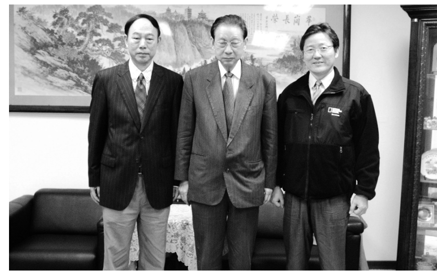
劉春田教授(左一)拜訪張董事長，劉教授與林柏杉前學務長(右一)有師生之誼

【文 / 李文瑜】中國人民大學研究生院副院長、知識產權教學與研究中心主任劉春田教授接受本校邀請擔任客座教授，指導華岡學生「中國大陸知識產權法專題」，7日特別拜訪張鏡湖董事長。張董事長特別向劉春田教授分享中國大陸經濟發展的觀念與隱憂，雙方相談甚歡，劉春田教授則以時間與空間的概念，延伸對中國文化大學此一美麗的校園最美好的教學經驗。