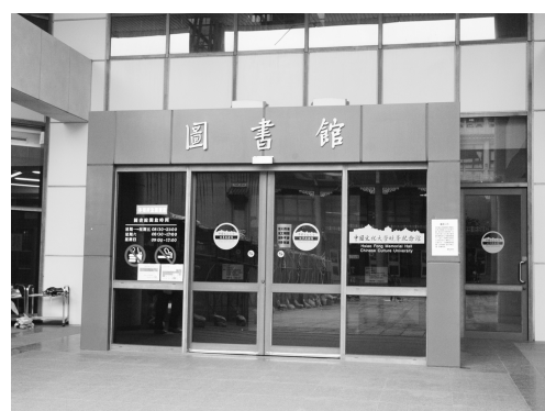
圖書館為台灣十大大學知名圖書館

「你圖書館了沒？」使用手冊，可至曉風圖書館二樓櫃台索取，若系所欲大量索取也可向圖書館方申請。詳細情形請洽圖書館或上網：www.lib.pccu.edu.tw