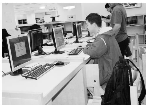
資訊化的查閱書籍相當貼心