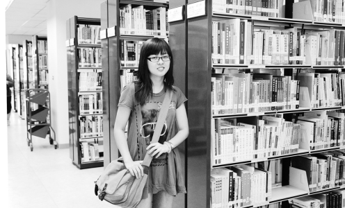
背著包包進圖書館解禁 當個圖書館背包客自由悠遊圖書館