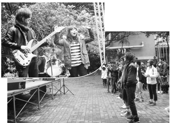
熱音社實力演出，熱情搖滾吸引同學目光

文化熱音社接下來將於4月28日(三)下午6時在大恩102將舉辦「范逸臣之酷愛樂團校園座談會」，現場酷愛樂團將與同學們分享從學生時代懷有音樂夢想到現今一路走來的甘苦經歷。范逸臣將親自出席，並現場指導唱歌技巧以及樂團吉他手黃冠龍現場教學示範，同學還可自由提問，會後則