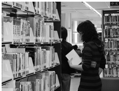
簡單的查詢閱覽備受學生肯定