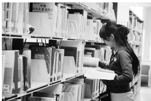
圖書館是愛書人的知識殿堂