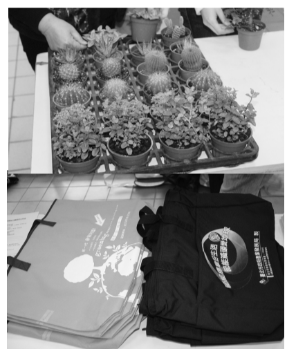
袋、盆栽、複寫式光碟片、滑鼠墊、環保杯、環保筷、立式相本、證書夾、明信片、筆記本、地球日貼紙等等。

份精神，努力在戲劇中尋找出自己的熱情。王慰慈副教授表示，在影像製作這塊領域，想要有所突破，甚至闖出名聲就必須主動去學習各領域的相關知識，如剪接、燈光、攝影、編劇、美編甚至編導等技能，都是必須去接觸學習，才有可能再拍一部影片時，發揮各部們最大的能力，拍出一部好影片。