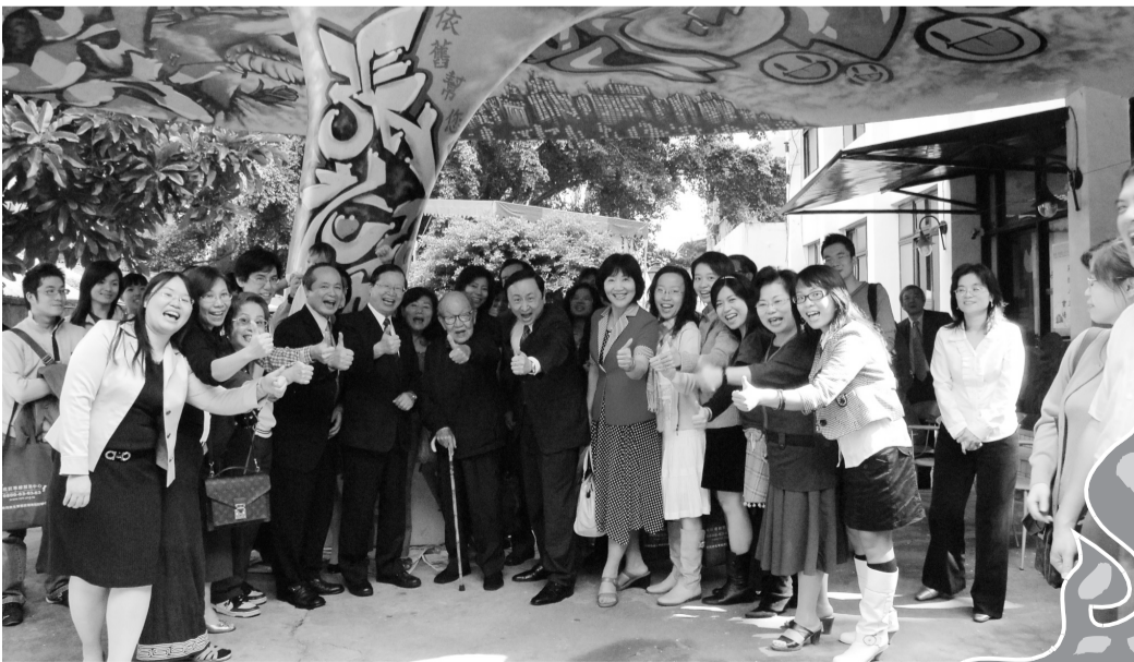
宋董事與張老師團隊合影