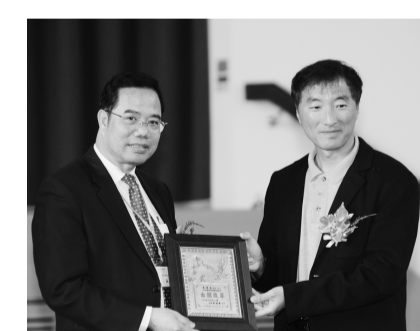
明志科大校長頒發傑出校友於吳校長，經過四年半的努力，終於在民國80年5月拿到博士學位。當時中山大學和成功大學遴聘自己擔任兼任老師，於民國81年3月進入成功大學，基於厚實的實務經驗，以專案實例探討理論推演時得心應手，經過3年半就升等為教授；並在87年就擔任企管系主任及國企所所長，90年兩任院長任期屆滿，學資歷與產學經驗豐富，今年更獲選成為中國文化大學校長，明志科技大學特別頒發傑出校友殊榮，感謝吳校長使明志科大發光發熱。

士，經過四年半的努力，終於在民國80年5月拿到博士學位。當時中山大學和成功大學遴聘自己擔任兼任老師，於民國81年3月進入成功大學，基於厚實的實務經驗，以專案實例探討理論推演時得心應手，經過3年半就升等為教授；並在87年就擔任企管系主任及國企所所長，90年兩任院長任期屆滿，學資歷與產學經驗豐富，今年更獲選成為中國文化大學校長，明志科技大學特別頒發傑出校友殊榮，感謝吳校長使明志科大發光發熱。