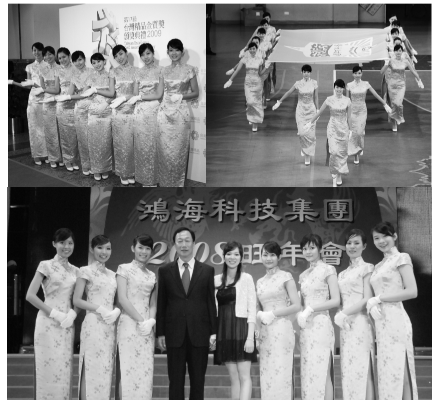
親善團活動精彩，邀請同學成為華岡美麗親善大使

華岡親善團服務多元，包括協助接待外賓、支援慶典活動等服務工作，提升本校形象的相關活動，近年來更是北區各大型活動的要角，包括曾服務職訓局金展獎、復北車行地下道通車典禮、